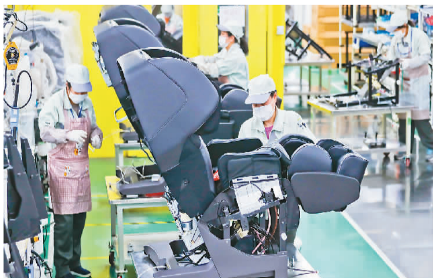
松下住宅电器(上海)有限公司工厂车间内，工人正在赶制按摩椅产品。

宗长青介绍，从主要目标来看，《规划》提出“十四五”时期利用外资发展的目标是：利用外资规模位居世界前列，利用外资大国地位稳固，利用外资结构持续优化，与对外投资、对外贸易、促进消费的联动作用进一步加强，为促进国内经济大循环、联接国内国际双循环发挥更加积极作用。“2035年远景目标是：我国吸引外商投资的综合竞争优势更加明显，利用外资水平显著提高、质量大幅提升，营商环境国际一流，成为跨国投资主要目的地，打造东亚地区的创新和高端制造中心，参与国际经济合作和竞争新优势明显增强。”宗长青说。