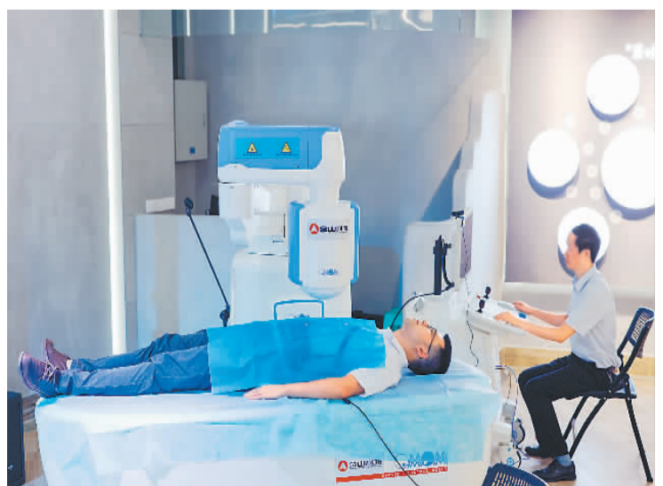
在重庆金山科技（集团）有限公司发布会现场，技术人员操作中国自主研发的RC100全自动导航腹腔镜机器人演示全自动胃镜检查。