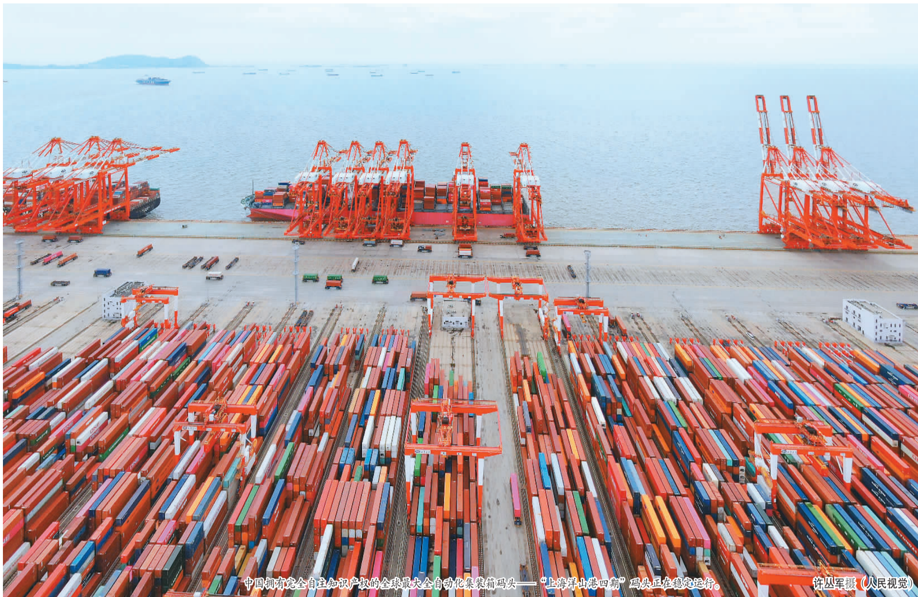
中国拥有完全自主知识产权的全球最大全自动化集装箱码头——“上海洋山港四期”码头正在稳定运行。