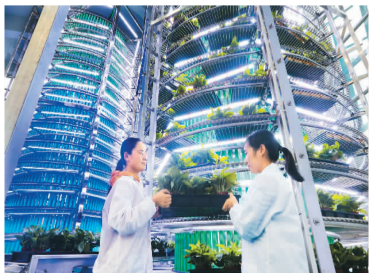
在安徽金晟达生物电子科技有限公司的“七天牧场项目”基地，员工们运用新研发的生物补光技术促成种子在7日内长成植物。

通过改革，越来越多的知识产权成果走下“书架”，走上“货架”。科技部成果转化与区域创新负责人黄圣彪近日表示：“科技成果转化所有权、使用权、收益权改革取得了新突破。科技部会同国家知识产权局等8部门联合开展了赋予科研人员职务科技成果所有权或使用权试点，激发了科研人员创新和转化积极性，成果转化的政策环境得到进一步改善。”