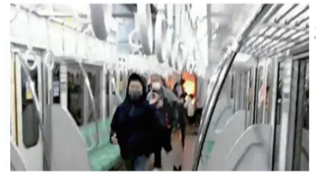
車内列車車内火災

國際日報報書網址： https://www.facebook.com/InternationalDaily