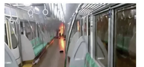
ツイッターに投稿された電車内の映像。車両奥に炎が見える