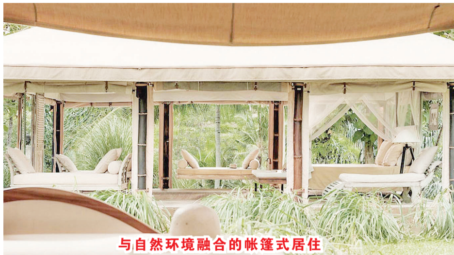
与自然环境融合的帐篷式居住