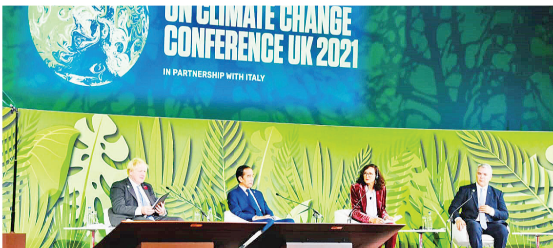
佐科维等领导人11月2日摄于在苏格兰活动园区举行的森林和土地利用世界领导人峰会

【本报讯】包括印尼在内的100多位国家领导人在当地时间周一(11/1/2021)晚间承诺,到2030年已能停止森林砍伐和土地破坏。 这承诺得到了国家和私营部门190亿美元投资资金的支持,以保护和恢复森林的情况。 在苏格兰格拉斯哥举行的COP26气候峰会发表的《联合声明》,得到了印尼、巴西和刚果等国家领导人的认可。 英首相约翰逊说:“我