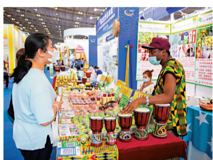
●在長沙舉行的第二屆中國—非洲經貿博覽會上，觀眾選購非洲護膚品。

●將增進人民福祉、實現人的全面發展作為出發點和落腳點，把發展合作置於全球宏觀政策協調和二十國集團議程的突出位置，着力解決貧困、發展不平衡等問題。