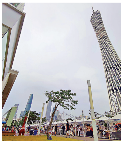
●廣東前三季GDP總量超過8.8萬億元人民幣，穩居全國第一。圖為廣州市。資料圖片

今年以來，西部多個省份GDP增速普遍低於全國水平。重慶GDP兩年平均增速高於其他西部地區，成為西部地區中今年前三季度增速唯一高於全國GDP增速的地區。