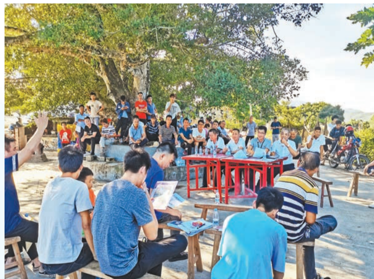
「榕樹下議事會」改寫村落的未來。

空間是城市可持續發展的根基與未來。隨著深汕合作區全力開展「土地整備攻堅行動」，在充分保障群眾合法利益的同時，如何高效地處理好徵拆談