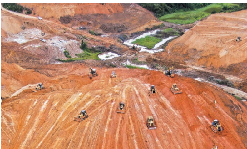
比亞迪深汕項目土地整備現場。