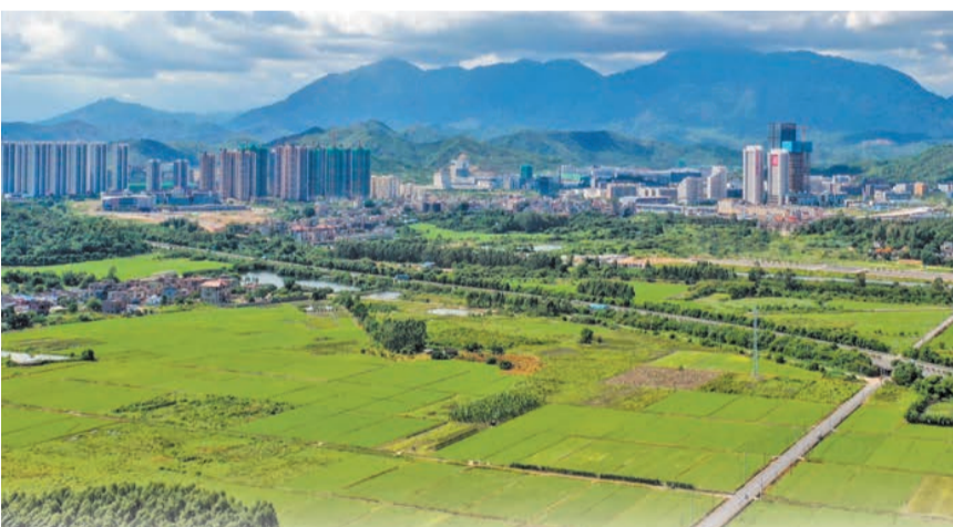
深汕合作區着力打造有山有水、體現生態自然的「都市鄉村」「田園城市」。

截至目前，深汕合作區已供地產業項目100個（92個來自深圳），其中，已投產36個，開工在建36個，開展前期工作28個。計劃總投資超600億元，全部達產後預計年產值近千億元，全力打造智能網聯汽車、新能源、安全節能環保、新材料、海洋產業、智能機械人等六大產業集群。