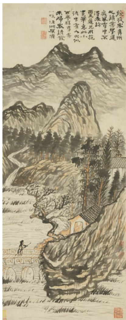
石濤作品《真州除夜圖》。