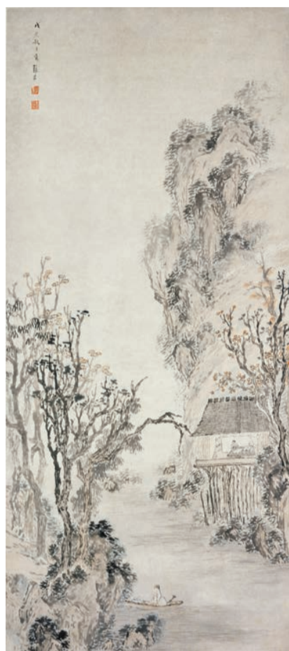
張宏作品《溪山秋色圖》。

日期：即日起至2022年2月16日 時間：星期一至三、五上午10時至下午6時；星期六、日及公眾假期上午10時至晚上7時；聖誕前夕及農曆新年除夕上午10時至下午5時；星期四（公眾假期除外）、農曆年初一及二休館 地點：尖沙咀梳士巴利道10號香港藝術館二樓虛白齋藏中國書畫館