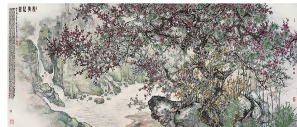
蕭暉榮作品《繁華似錦》，192 x 500cm，2021年。

蕭暉榮擅畫繁華，喜作大畫，這丈六匹《繁華似錦》延續了他一貫的畫風，並在梅花與山水結合上為觀者展現了一個嶄新的境界。此畫構圖極富匠心，整體是以山水畫的布局繪寫梅花圖，構思精妙，虛實相生，變化靈動，動靜相宜，疏密有度，韻致深遠。