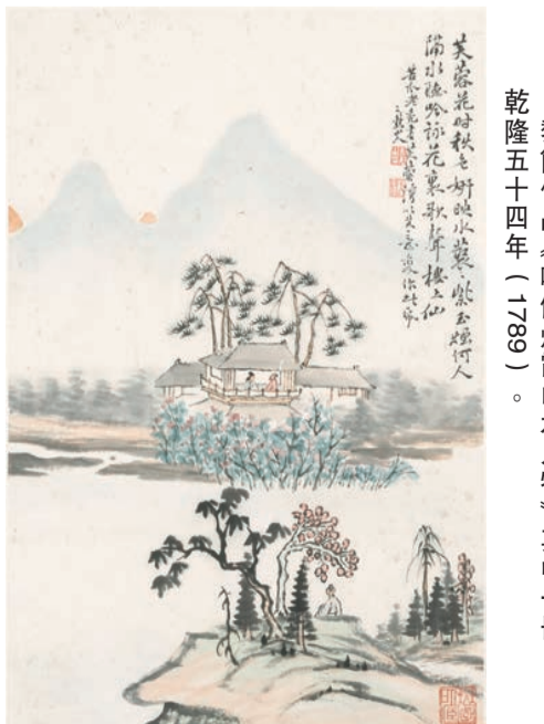
黎簡作品《嘯傲煙霞山水人物》其中一冊，乾隆五十四年（1789）。

地點：香港中文大學中大文物館展廳I及II 內容：嶺南位處中國邊陲，是面向世界的前端。縱觀廣東文化思想的發展，從靜水流深至廣納百川，每逢有影響深遠的宗教或新思想來到，嶺南總是孕育出名留青史的人物。現正舉辦的展覽「廣納百川：明至清中期廣東書畫選」為上半年同系列展覽的第二期，展出逾七十組畫作、書法及碑帖，凸顯清代廣東的文藝創作高峰和其時盛行的士商雅集鑒藏文化。