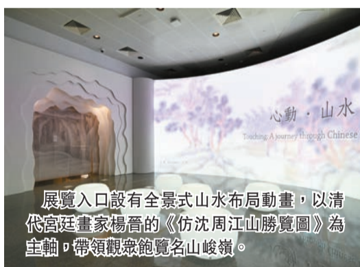
展覽入口設有全景式山水布局動畫，以清代宮廷畫家楊晉的《仿沈周江山勝覽圖》為主題，帶領觀眾飽覽名山峻嶺。

「旅遊路線」各有特色，記者最喜愛的是「清心之旅——隱逸山水」、「探秘之旅——奇觀山水」。