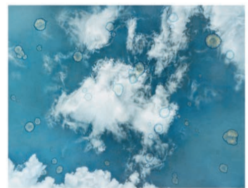
卓有瑞「蒼穹系列」作品《20214》。

內容：時間難以捕捉，藝術家卓有瑞致力詮釋抽象的生命現象，如時間的足跡、流動的光影。現正舉辦的「霧雲心迹：卓有瑞新作展」，展出「霧影系列」及「蒼穹系列」，分別是藝術家於2020年與2021年創作的作品。