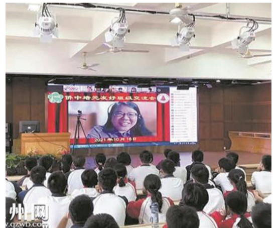
兩國學子“雲端”相會

泉州網10月26日訊（記者傅蓉蓉 通訊員傅健 黃霞蘭 文/圖）近日，泉州培元中學和菲律賓僑中學院的同學們通過雲端連線方式，線上相聚，分享各自的學習生活，深入了解兩國文化。