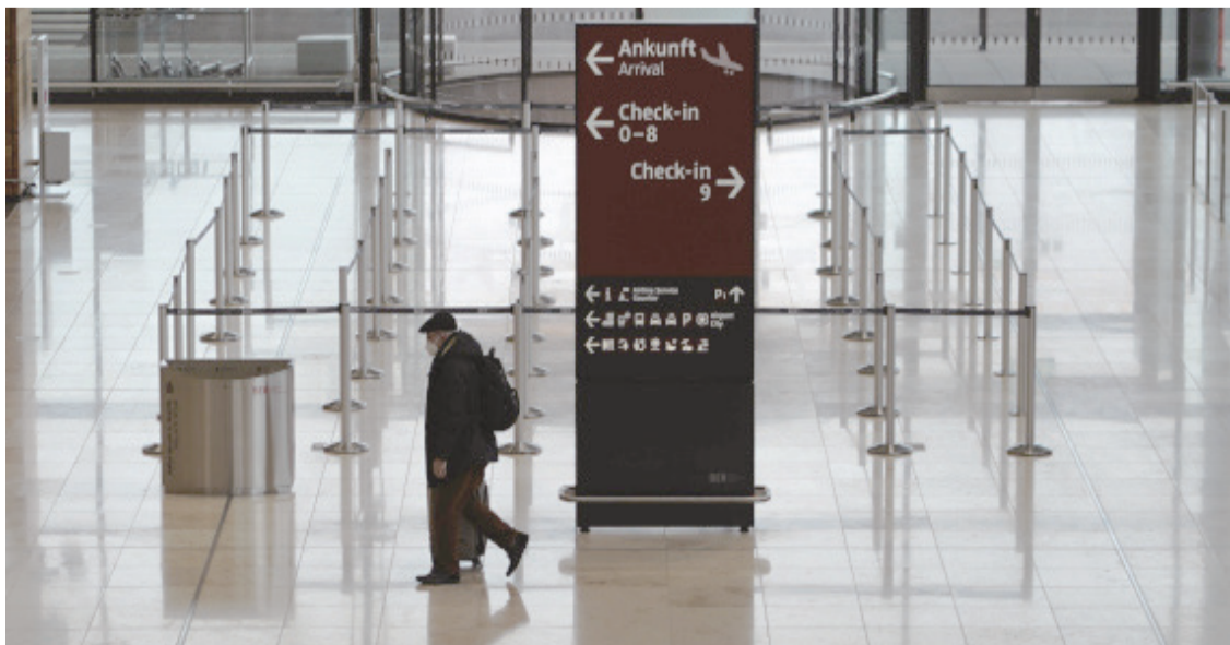
新華社北京10月31日電 德國首都柏林新機場啟用一年後出現諸多問題，運營方面臨財務危機。