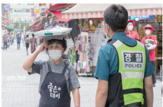
新華社北京10月31日電 新冠疫情下，

外賣生意火爆。送餐員跑一趟通常派送多份訂單，有時難免送餐超時。因此，韓國多家送餐平臺推出以價格換速度的訂單專送服務。