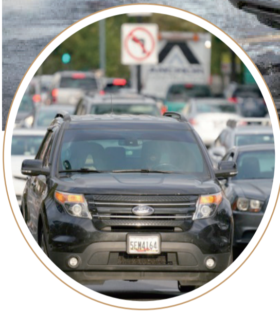
新華社北京10月31日電 美國當前供應鏈緊張不僅影響汽車生產，還波及汽車牌照製造。因為缺少原材料鋁，美國多個地區已經暫

停車牌製造。美聯社30日援引蒙大拿州管教局發言人卡羅琳·布賴特的話報道，州立監獄生產部門用于製造車牌的鋁已經告罄。一些官員說，下一批鋁預期最早12月才能到貨。