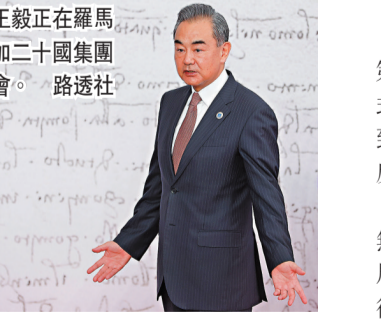
●王毅正在羅馬參加二十國集團峰會。

王毅說，1971年，聯合國大會以壓倒性多數通過第2758號決議，決定恢復中國在聯合國的合法席位，已經從政治上、法律上和程序上徹底解決了中國在聯合國