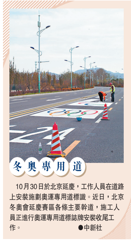
●10月30日於北京延慶，工作人員在道路上安裝施劃奧運專用道標識。近日，北京冬奧會延慶賽區各條主要幹道，施工人員正進行奧運專用道標誌牌安裝收尾工作。

政綱關於具體政策的論述中提到，中國國民黨始終堅決反對「台獨」，將延續過去黨章、黨綱內容，包括2005年國共兩黨共同發布的兩岸和平發展五項願景，以及馬英九執政期間的基本方針，推動兩岸在「九二共識」基礎上，開展各項有利於兩岸和平穩定發展的工作，促使兩岸關係重返和平繁榮的康莊大道，共同落實孫中山先生「振興中華」「天下為公」的理想。