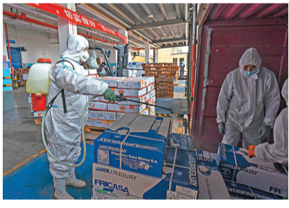
●武漢工作人員對進口冷鏈食品進行消毒。

香港文匯報訊 據新華社報道，針對美國國家情報總監辦公室發布新冠病毒溯源問題解密報告，中國外交部發言人汪文斌10月31日答記者問時表示，在美國情報部門8月發布這份所謂溯源問題解密報告摘要時，中方就表明了堅決反對的態度。謊言重複千遍仍然是謊言。這份報告無論發布多少遍、炮製多少版本，也改變不了其徹頭徹尾的政治報告和虛假報告的性質，毫無科學性和可信度。