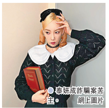
泰妍被指前年花費11億元韓幣(約731萬港元)購入一處土地,結果入手後才發現該處土地是無法開發的保護地,大筆金錢被騙去

香港文匯報訊(記者凡文)韓國女團「少女時代」成員泰妍,前日被爆捲入土地欺詐。泰妍被指前年花費11億元韓幣(約731萬港元)購入一處土地,結果入手後才發現該處土地是無法開發的保護地,大筆金錢被騙去