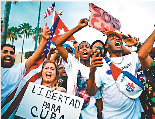
●美國煽動古巴人情緒，終爆發示威。