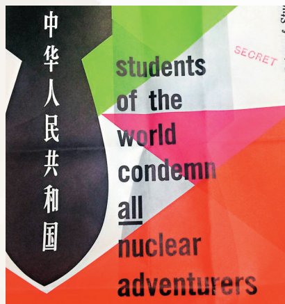
●IRD將學生反對核試海報中的「美國」改成「中國」。網上圖片

英國外交部解密文件揭露印尼「930」事件的幕後推手，正是外交部在冷戰時期成立的秘密部門訊息調查部（IRD）。該部門在成立數十年間曾多次以散播假新聞方式，煽動輿論攻勢，以攻擊蘇聯等敵對陣營，近2,000份IRD文件直至前年才被陸續曝光，揭開英國政治宣傳戰的黑幕。