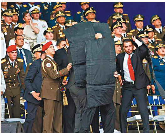
●2018年馬杜羅（站在手持保護板的隨從後方）險被暗殺。