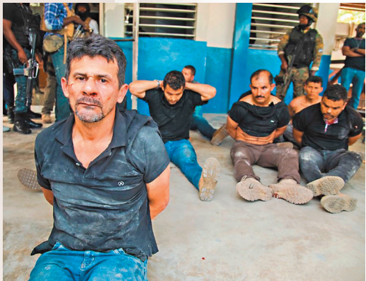
●被拘捕的刺殺案疑犯中，至少兩人屬美國籍。網上圖片