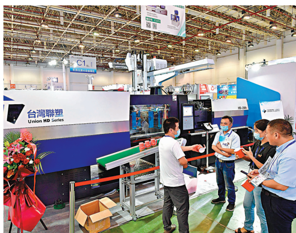
● 台商和台灣百姓都希望兩岸關係和平穩定地向前發展。圖為今年6月, 客商在2021廈門工博會上的台灣企業展參觀交流。

他說, 台商和台灣百姓都希望兩岸關係和平穩定地向前發展, 希望蔡英文和民進黨能正視兩岸的現狀, 切勿挾洋自重, 充當美國的棋子, 將美麗的台灣推向戰爭的邊緣。