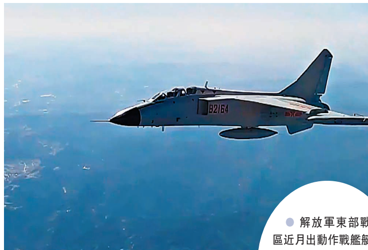
● 解放軍東部戰區近月出動作戰艦艇、反潛機、殲擊機等多軍種力量, 在台島周邊海空域實兵演練。 視頻截圖

據報, 有台所謂「陸軍司令」率團赴美, 其間參加美陸軍協會年度會議, 並與美防務部門和軍隊人員會面。針對民進黨當局近期一再炒作美台軍事聯繫, 國防部新聞局副局長、國防部新聞發言人譚克非大校28日在例行記者會上答問時表示, 我們注意到有關報道, 已向美方表達嚴重關切並提出嚴正交涉, 要求美方必須就此向中方作出澄清。一個中國原則是中美關係的政治基礎。中方堅決反對美方與中國台灣地區進行任何形式的官方往來和軍事聯繫。