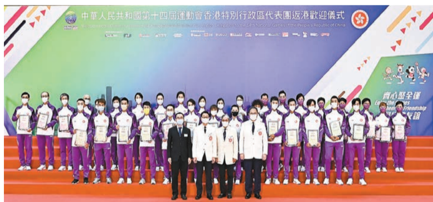
全運會香港代表出席返港歡迎儀式。

民政事務局局長徐英偉昨午啟程前赴陝西省西安市，出席全國殘疾人運動會閉幕式，並會參加會旗交接儀式。徐英偉將於10月30日下午回港，在他離港期間，民政事務局副局長陳積志將署任民政事務局局長。