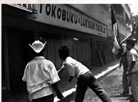
●1965年印尼發生針對共產黨人和華裔的屠殺及襲擊。