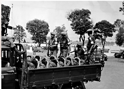
●印尼軍方針對印尼共等人士進行大規模屠殺。網上圖片

1965年至1966年間，印尼發生震驚全球的反共排華事件，印尼軍方以鎮壓印尼共產黨（印尼共）政變為由發動軍事政變奪權，隨後展開針對印尼共成員、左翼人士以至華人的大規模屠殺，造成至少50萬人遇害。英國外交部最新解密文件揭露，英國情報機構及冷戰宣傳部門的特工，原來在這宗事件中扮演了關鍵角色，包括利用「黑色宣傳」煽動印尼陸軍將領在內的反共分子要「切除共產主義毒瘤」，更呼籲「消滅印尼共及所有共產主義組織」，導致大屠殺愈演愈烈。 ●香港文匯報記者 林文佑