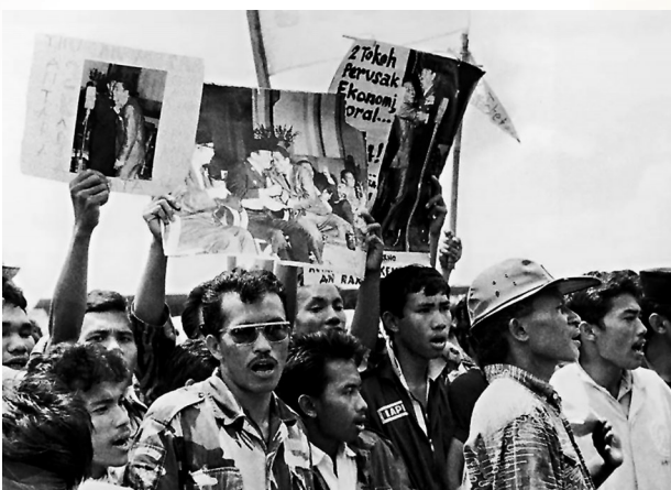
●1966年雅加達學生抗議總統蘇加諾。

在該批文件中，包括美國駐雅加達大使館1965年向國務院發送的一份電報，當中一名美國政務參贊描述了印尼官員如何解決監獄裏印尼共產黨嫌疑成員人滿為患的問題：「通過處死印尼共囚犯，或是逮捕之前就殺死