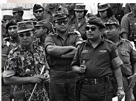
●1965年蘇哈托（左二）與軍人現身。資料圖片