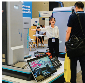
●在今年9月舉辦的世界新能汽車大會上，一款自動柔性充電機器人引人關注。資料圖片

三是要在這次大會上突出「落實」。積極倡導各方切實落實目標，將目標轉化為落實的政策、措施和具體行動，避免把提出目標或提高目標變成空喊口號或差別化指責。比如，發達