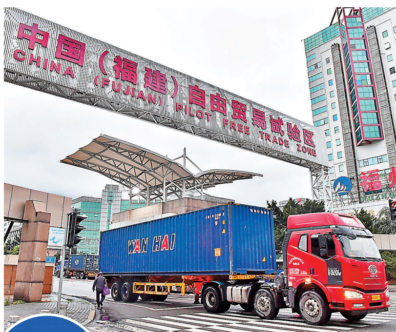
●得益於自由貿易試驗區的大範圍試點，推動了中國服務貿易在全球排名的顯著提升。圖為貨櫃車駛出福建自貿區福州片區。資料圖片