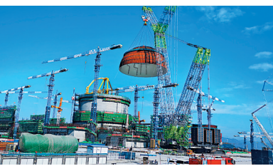
●「華龍一號」在漳州內穹頂內穹頂。