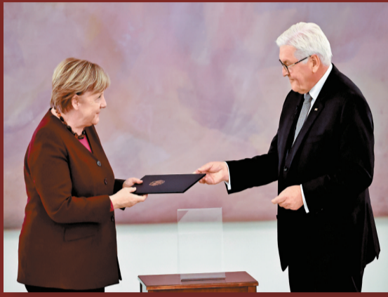
德國總統施泰因邁爾向默克爾遞交了任期結束通知。