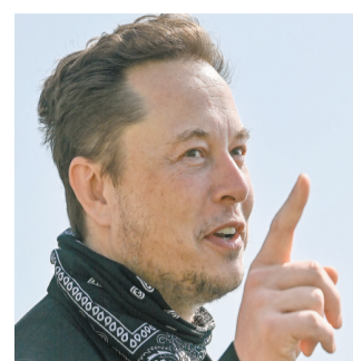
馬斯克有望成為全球第一個身家達3000億美元的超級富豪。

【香港商報訊】根據福布斯富豪榜的最新數據，特斯拉CEO、全球首富馬斯克的財富超過2500億美元，彭博億萬富豪榜的數據則顯示馬斯克的財富超過2800億美元。福布斯新聞網稱，馬斯克的財富接近3000億美元，是歷史上最富有的人。而且，馬斯克可能很快