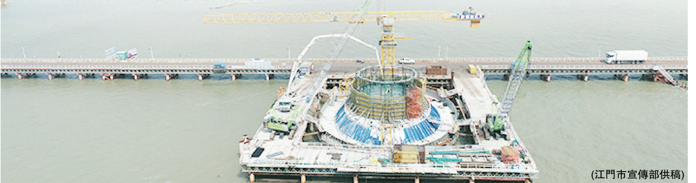
(江門市宣傳部供稿)

泥；西塔承臺正在破樁頭。黃茅海大橋主塔塔基已全部完成，東塔承臺正在進行首層鋼筋綁紮；中塔承臺已完成，目前正在綁紮塔座鋼筋；西塔承臺、塔座已完成。預計今年12月底前可完成高欄港大橋、黃茅海大橋5座主墩承臺施工任務。(文/圖 畢鬆杰 楊須通 陳振宇)