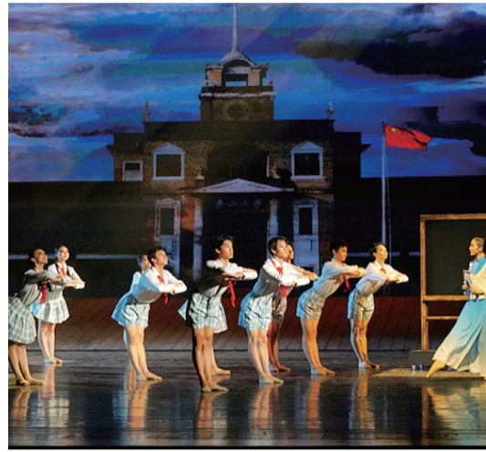
《僑批·家國》配圖。