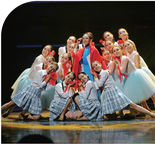
《僑批·家國》講述了一段華僑群體與家國命運交織的故事和歷史。