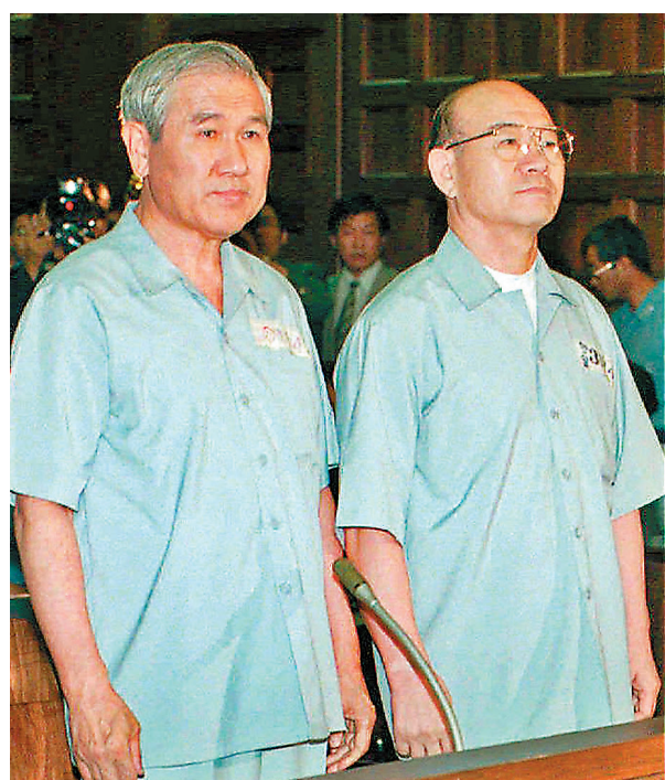
● 1996年，盧泰愚與全斗煥一起受審。