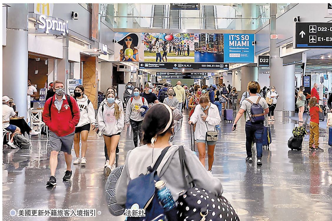
●美國更新外籍旅客入境指引。