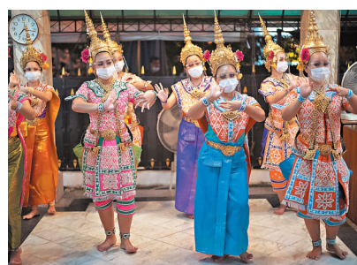
●曼谷表演者戴上口罩。