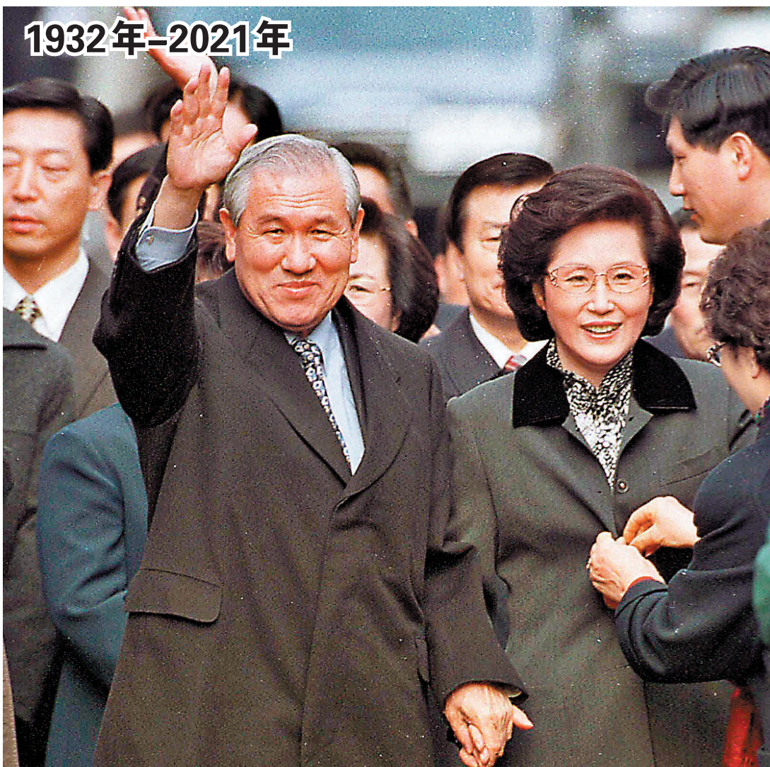
● 1997年12月22日，盧泰愚獲特赦後回家，與支持者及鄰居揮手，其夫人陪伴在側。