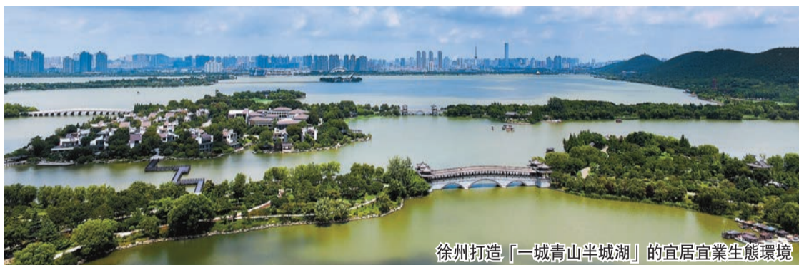
徐州打造「一城青山半城湖」的宜居宜業生態環境

今年9月，徐州市第十三次黨代會確立了「建設產業強市、打造區域中心」的戰略目標，明確了大抓產業、重抓製造業的鮮明導向。未來五年，徐州將聚力聚建產業強市，構建以創新為引領的「6+4」先進製造業體系，形成3千億規模的工程機械與智能裝備產業集羣和2個千億規模產業集羣，推動六大新興產業總產值突破6千億，規上工業總產值和工業開票銷售收入「雙超萬億」，真正讓「產業強」成為徐州發展的顯著標識，打造享譽全球的「中國工程機械之都」。