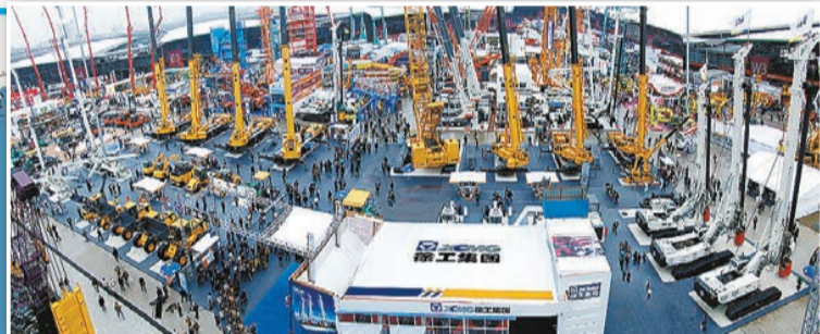
中國最大工程機械生產研發製造基地