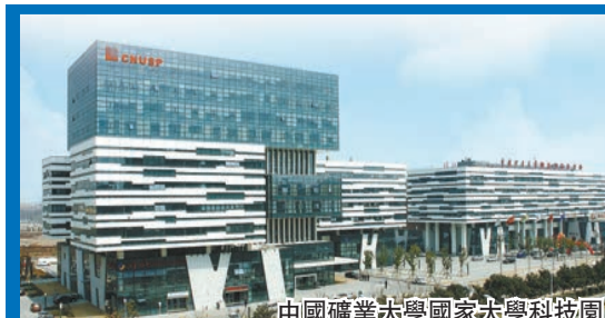
中國礦業大學國家尖峯科技園

位發展、優勢互補，支持企業跨區域兼併重組，打造一批特色優勢突出、核心競爭力強的區域產業集羣。徐州將帶頭促進創新協同，支持區域內聯合構建創新共同體和科創平台，鼓勵創新成果跨城市轉移轉化，聯手推進科技技術攻關，為區域創新發展提供有力支撐；將帶頭促進園區合作，加強各級園區產業規劃、政策、項目等對接，創新「總部+基地」「研發+生產」等跨區域合作模式，加快提檔升級徐宿現代產業園區、泉山蕭縣合作園區，適時啟動徐東等共建園區建設，推動區域發展互利共贏；將帶頭促進要素流動，主動破除區域間行政和市場壁壘，推進統一市場共建、樞紐資源共享、制度開放共促，加快都市圈物流一體化發展，做大用好淮海經濟區投資基金，不斷提高區域資源配置效率。同時，將全力支持縣域層面跨區域合作，進一步拓展合作交流廣度深度，與各兄弟城市一道，共建「1小時通勤圈」「一日生活圈」、共建區域大市場、共建幸福生活都市圈、共建美麗新淮海，真正將淮海經濟區建成服務國家重大區域戰略的重要功能區、跨省際交界協同創新發展的先行試驗區、資源連片地區整體振興轉型的示範樣板區、區域中心城市驅動都市圈發展的創新實踐區。