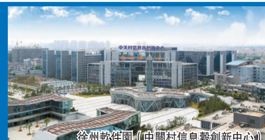
徐州軟件園（中關村信息穀創新中心）