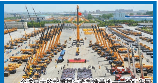
全球最大的起重機生產製造基地——徐工集團