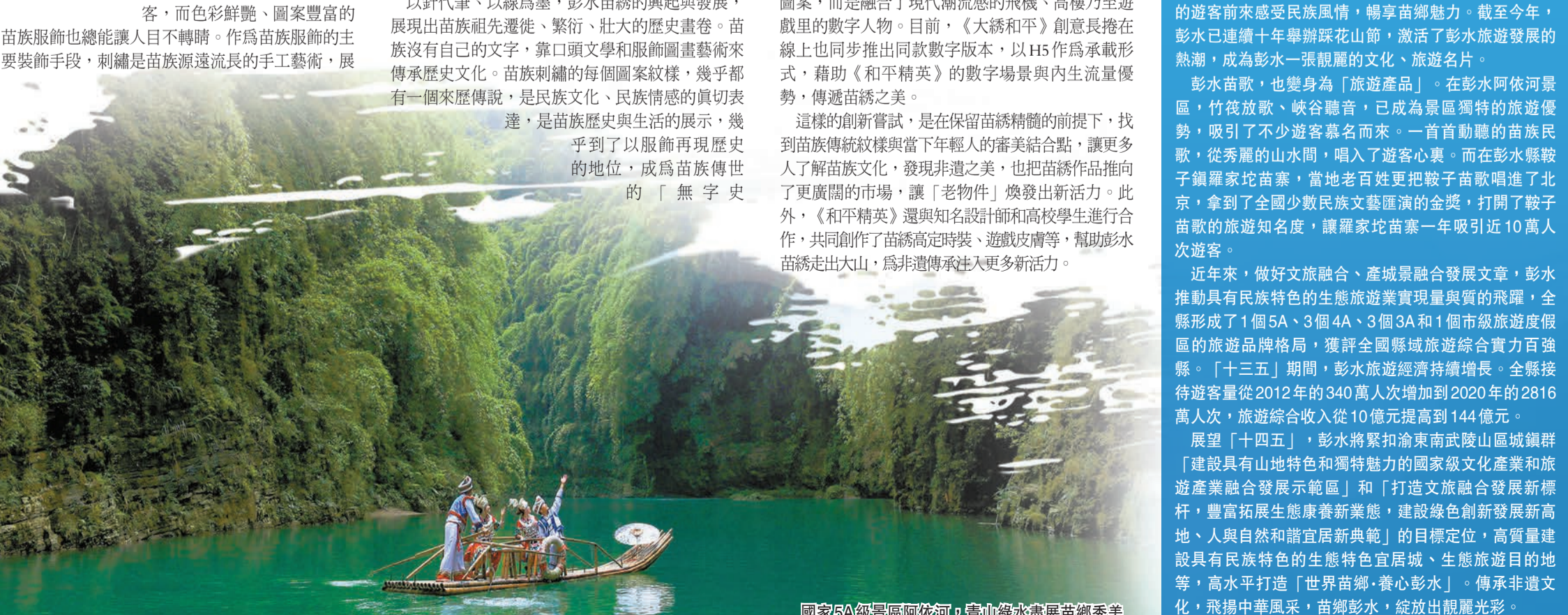
國家5A級景區阿依河，青山綠水盡展苗鄉秀美