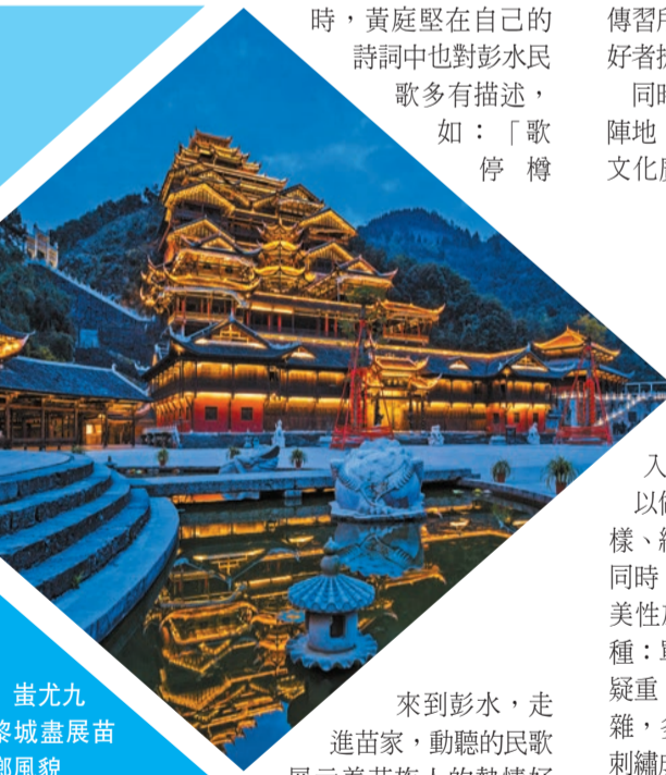
蚩尤九黎城盡展苗鄉風貌

近年來，做好文旅融合、產城融合發展文章，彭水推動具有民族特色的生態旅遊業實現量與質的飛躍，全縣形成了1個5A、3個4A、3個3A和1個市級旅遊度假區的旅遊品牌格局，獲評全國縣域旅遊綜合實力百強縣。「十三五」期間，彭水旅遊經濟持續增長。全縣接待遊客量從2012年的340萬人次增加到2020年的2816萬人次，旅遊綜合收入從10億元提高到144億元。