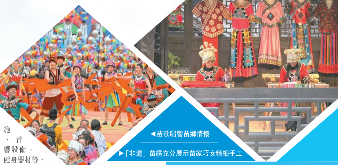
施、音響設備、健身器材等，逐步形成縣、鄉、村三級文化服務網絡體系。

同時，為強化民歌普及，彭水完善基層公共文化陣地，在衆多行政村實現了「七個一」標準，建設文化廣場、活動室、宣傳欄、簡易戲台、廣播設