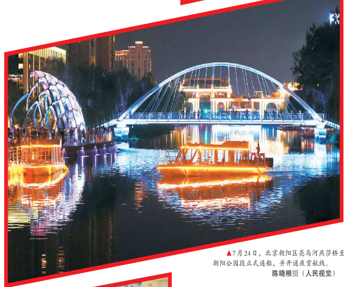
7月24日,北京朝阳区亮马河燕莎桥至朝阳公园段正式通航,并开通夜赏航线。

一套机制,就是建立“日通报、周汇总、月分析”等机制,每日汇总分析群众诉求情况,为市委市政府决策提供支撑,促提升,持续推动超大城市治理向精细化、智慧化转型。