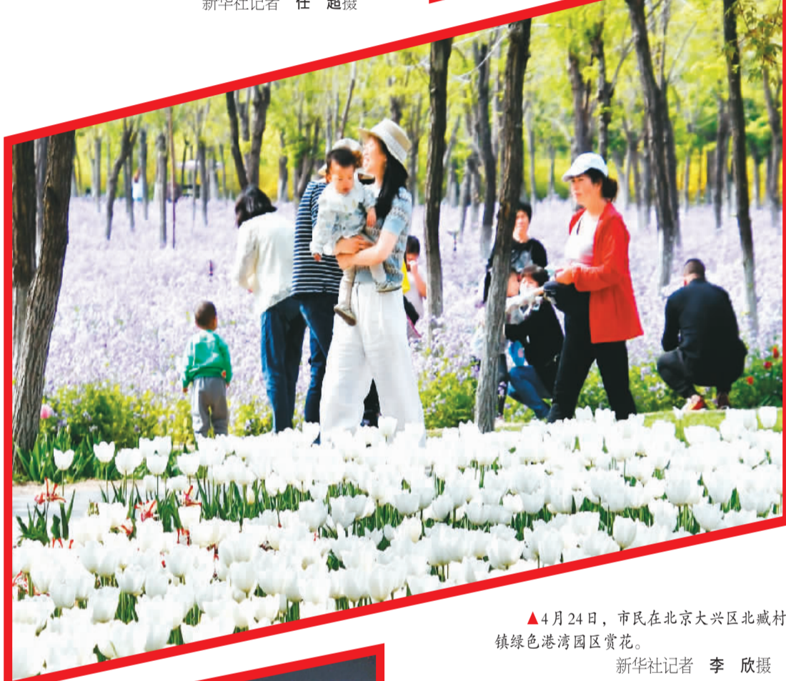
4月24日,市民在北京大兴区北臧村镇绿色港湾园区赏花。