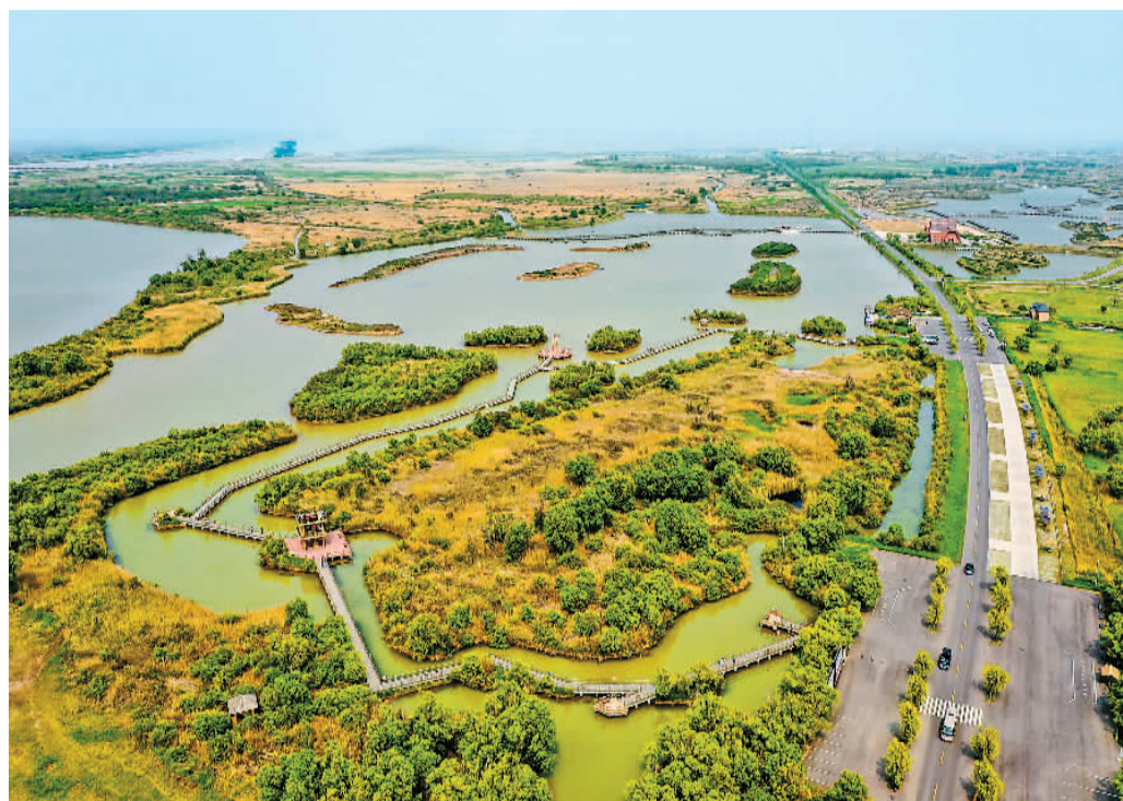
山东黄河三角洲国家级自然保护区景色。

穿森林、观植被、看动物、游湿地、走水岸、赏候鸟,或者仅是为了呼吸负氧离子浓度更高的新鲜空气,以特色生态环境为主要景观的生态旅游日益受到人们推崇。数据显示,中国的森林覆盖率超过23%,新增绿化面积全球第一;全国地表水优良水体比例达83.4%,绿水青山成为全面建成小康社会最亮丽的底色,也为生态旅游的发展提供了重要资源。目前,生态旅游已成为各地重要的绿色产业之一,不仅带动着当地经济发展,也促进了人们生活方式的转变。