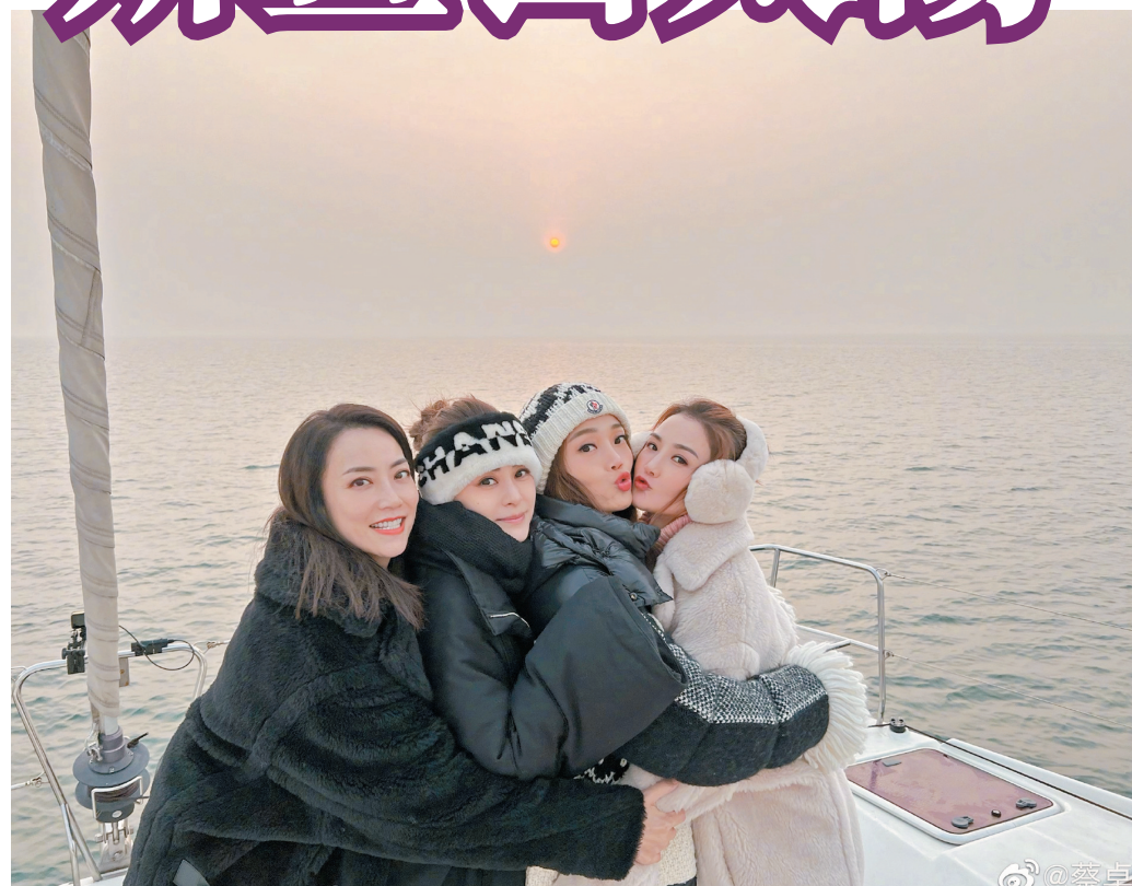
蔡卓妍與好姊妹出海看日出。