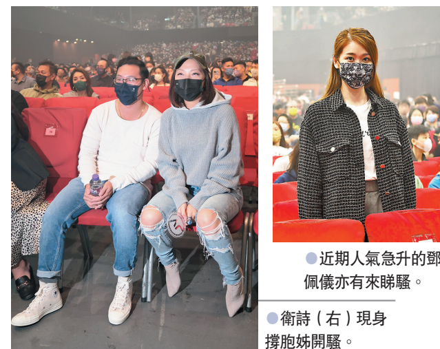
近期人氣急升的鄧佩儀亦有來睇騷。