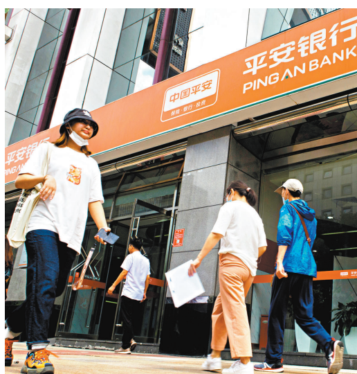
●平安銀行緊貼港澳居民的投資「胃口」，目前已有港澳客戶一口氣購買4款產品。

「新啟航三個月定期3號」共4款產品，成為平安理財首位「北向通」客戶。在跨境理財通與平安銀行形成合作關係的華僑永亨銀行，其內地子公司華僑永亨銀行(中國)多位高管在出席此次會議上，華僑永亨銀行(中國)董事兼首席執行官王克表示，對於港澳投資者，「北向通」中由內地公司發行的理財產品具有風格穩健、追求絕對收益的特徵，很好地契合了他們在低利率環境下追求資產保值增值的需求；同時，內地公募基金產品在配置A股優質上市公司標的方面具有比較優勢，有助於港澳投資者分享內地經濟發展與投資機會。