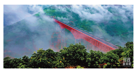
2021年7月，中老鐵路玉磨段元江雙線特大橋順利實現合龍。

發展，是實現人民幸福的關鍵。今年9月，習主席在第76屆聯合國大會上提出全球發展倡議，希望各國共同努力，構建全球發展共同體。