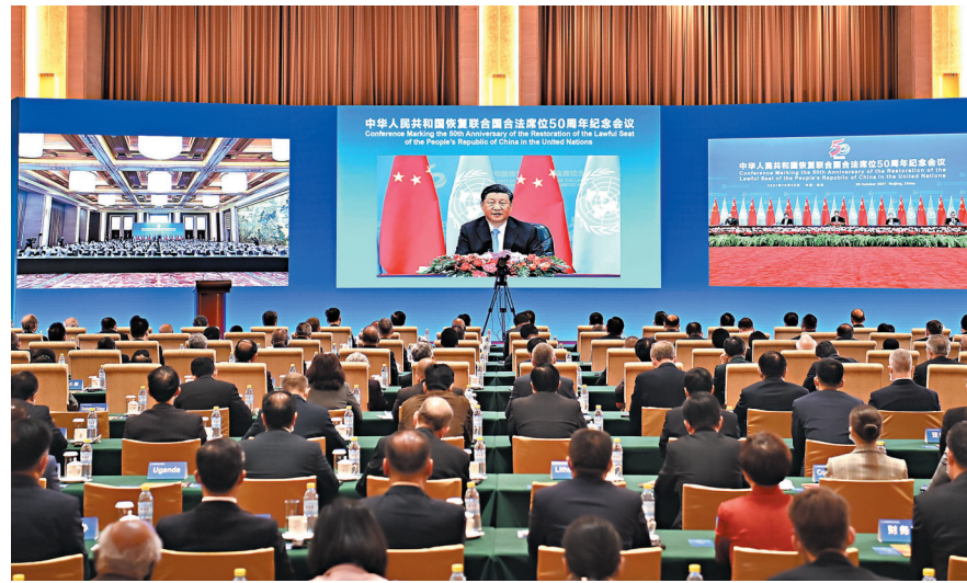
中華人民共和國恢復聯合國合法席位50周年紀念會議會場。新華社