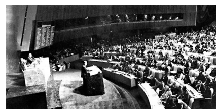
1971年10月25日，第26屆聯合國大會現場。資料圖片

「任何重大國際問題，如果沒有中華人民共和國的參與都是無法解決的。」在第26屆聯合國大會期間，阿爾及利亞等多個國家提出聯合提案，要求「恢復中華人民共和國在聯合國的一切合法權利和立即把台灣當局代表從聯合國及其所屬一切機構中驅逐出去」。