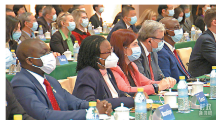
紀念會議分會場的與會嘉賓。