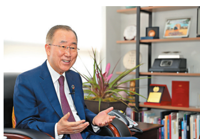
聯合國前秘書長潘基文日前接受專訪表示，在過去50年間，中國為實現聯合國理想作出了巨大貢獻。新華社

香港文匯報訊 綜合新華社及中新社報道，1971年10月25日，第26屆聯合國大會以壓倒多數通過第2758號決議，決定恢復中華人民共和國在聯合國的合法席位。50年來，中國深入參與聯合國事業，以實際行動堅定支持聯合國在國際事務中發揮更大作用。聯合國前秘書長潘基文近日接受專訪時指出，50年來，中國為實現聯合國理想作出了重大貢獻：中國作為聯合國安理會常任理事國之一，在世界許多地方積極投身和平與發展的崇高事業。中國的經驗也無可否認地表明，開放市場和自由貿易將是最有效的經濟發展方式。