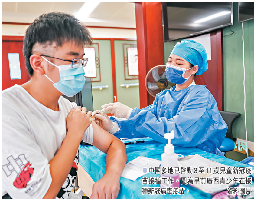
中國多地已啓動3至11歲兒童新冠疫苗接種工作。圖為早前廣西青少年在接種新冠病毒疫苗。資料圖片