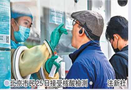
北京市民25日接受核酸檢測。