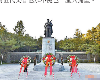
中國人民志願軍烈士陵園內的花圈。

金正恩表示，朝鮮人民將永遠不會忘記，全體志願軍官兵在擊退帝國主義侵略的同一個戰壕裏，為幫助我國革命而流下的鮮血和所建樹的豐功偉績，以血肉紐帶聯結的朝中友誼，無論世代交替也永不褪色、歷久彌堅。