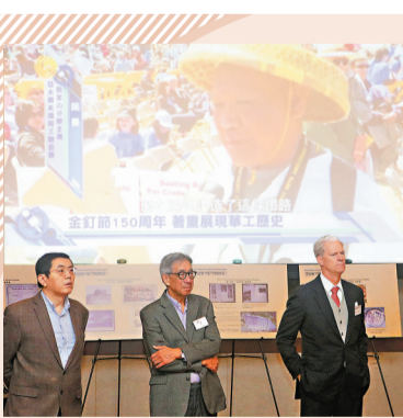
華人奮鬥史圖展紐約舉行

此外，「宏觀政策溝通協調」被再次提及，不僅說明務實經貿溝通切實推動中美關係向正軌回擺，而且反映出當前世界經濟復甦面臨極為嚴峻的形勢。今年以來在經貿領域的兩輪通話表明，以務實的姿態推進溝通，是解決問題的有效辦法。