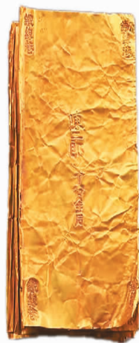
南宋“陈二郎”金叶子。

“‘陈二郎’金叶子为国家一级文物，反映了南宋杭州经济的发达。”潘沧桑说。金叶子由纯金制成，薄如纸，形似书页，上面刻有铭文“铁线巷陈二郎十分金”，其中“陈二郎”为制作金叶子的金铺名称。金叶子是南宋时期商品经济繁荣