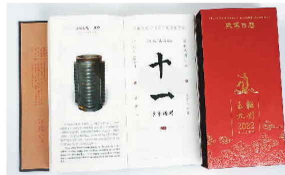
《2022陕博日历·玉蕴九州》。

本报电（田立阳）陕西历史博物馆《2022陕博日历·玉蕴九州》日前正式发行。这是自2018年以来陕西历史博物馆推出的第五本文物日历，也是正在筹备的“玉蕴九州”大型原创展览配套的文创产品。