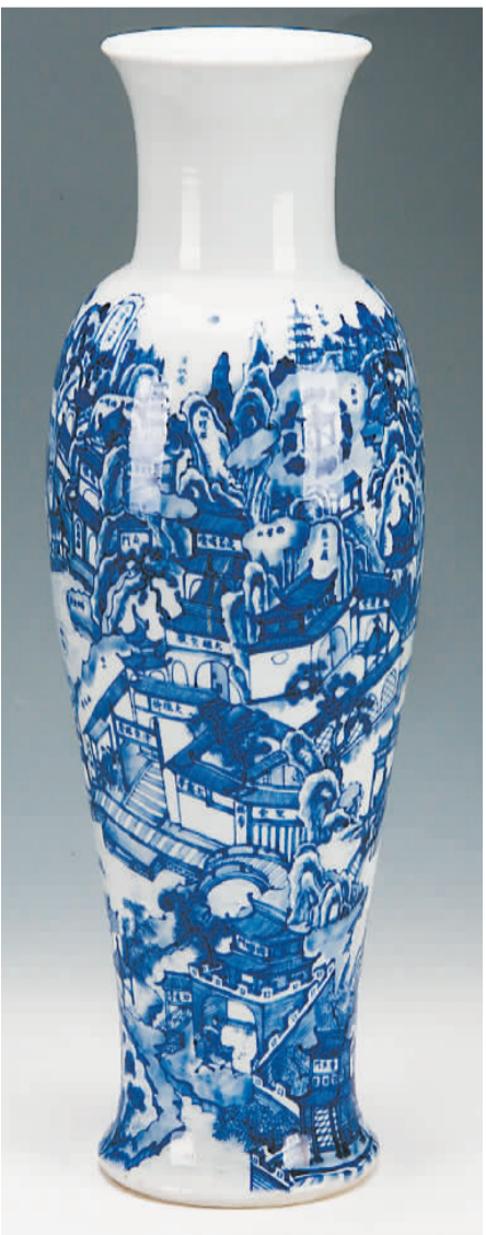
清康熙青花西湖风景观音瓶。

顺着阶梯下到馆中，大厅内巨大的沙盘模型立体展示了西湖“三面云山一面城”的格局。旁边展柜里，多种古生物化石体现了西湖丰富的自然遗存。据介绍，西湖一带原为浅海湾，大约