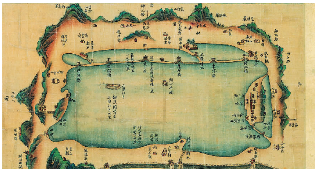
《清乾隆西湖行宫图》(局部)。