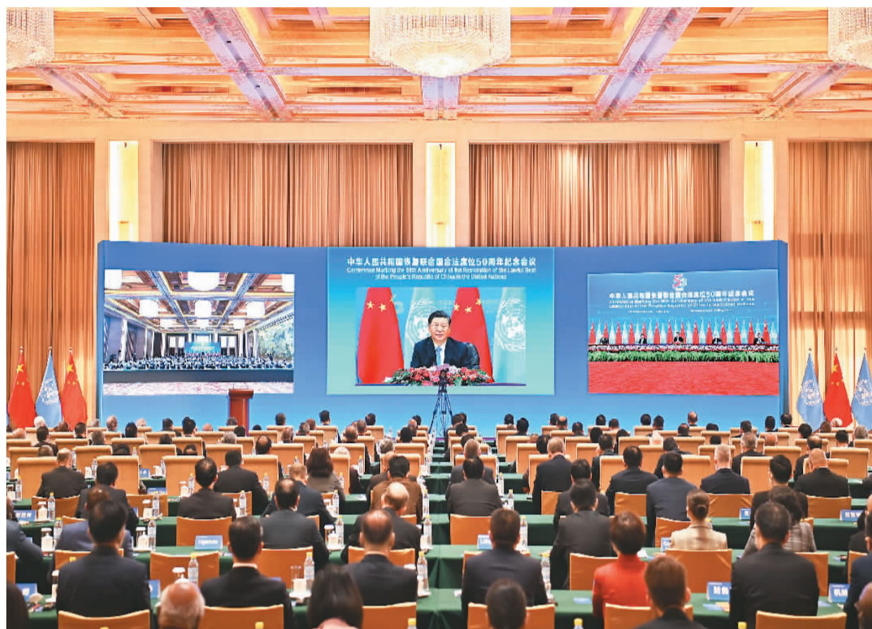
10月25日，国家主席习近平在北京出席中华人民共和国恢复联合国合法席位50周年纪念会议并发表重要讲话。

新华社北京10月25日电 国家主席习近平25日在北京出席中华人民共和国恢复联合国合法席位50周年纪念会议并发表重要讲话。习近平强调，新中国恢复在联合国合法席位以来的50年，是中国和平发展、造福人类的50年。中国将坚持走和平发展之路，始终做世界和