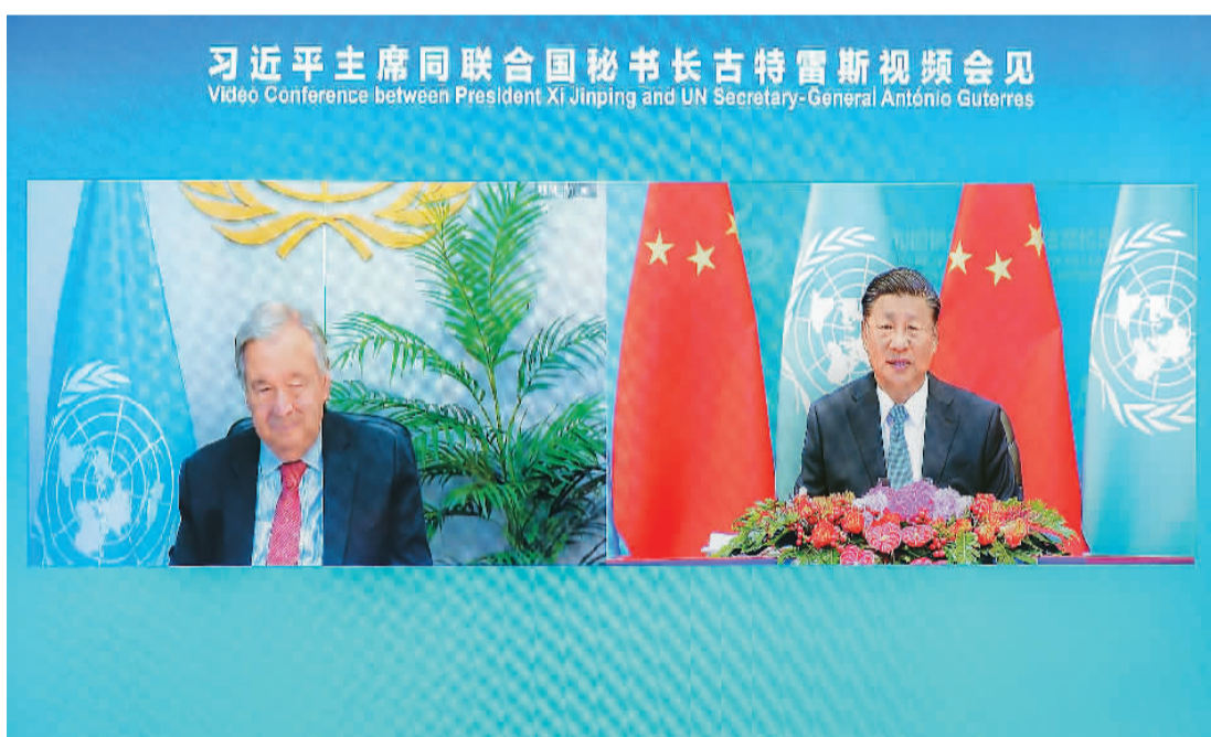
10月25日上午，国家主席习近平在北京人民大会堂以视频方式会见联合国秘书长古特雷斯。

新华社北京10月25日电 国家主席习近平25日上午在北京人民大会堂以视频方式会见联合国秘书长古特雷斯。