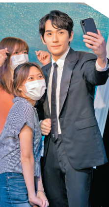
● 粉絲跟「朱一龍」自拍。