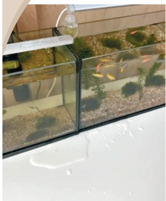
● Ella家中魚缸內的水也被晃了出來。

香港文匯報訊 台灣宜蘭24日連續發生兩次地震，分別達黎克特制6.5級和5.4級。6.5級是宜蘭地區30年來最大地震，專家稱未來3天內可能還會發生4級以上餘震。不少在台的藝人都透過社交平台發文，關心粉絲們是否無恙，其中S.H.E成員陳嘉樺地震發生時正在商場準備去看主演電影的首映，看到有店家的天花板直接掉下來，有小孩受到驚嚇在旁邊大哭，把她嚇壞。身處台灣的余文樂也感受到這次的強烈震撼，直呼：恐怖！