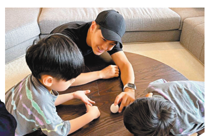
● 網友擔心林志穎一家在台的安，林志穎也特別在社交網報平安。