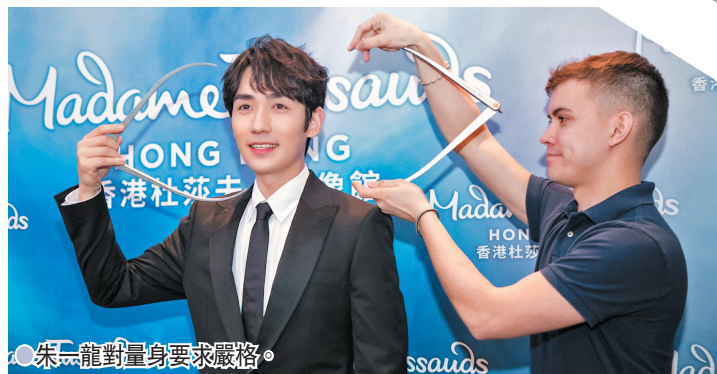
● 朱一龍對量身要求嚴格。

迎朱一龍加入，大讚對方是位專業又敬業的藝人：「他在量身時非常配合我們，同時對量身如同拍戲一樣認真，甚至比我們的蠟像師要求還要嚴格，非常敬業，期待大家蒞臨展館，近距離感受朱一龍的獨特魅力。」