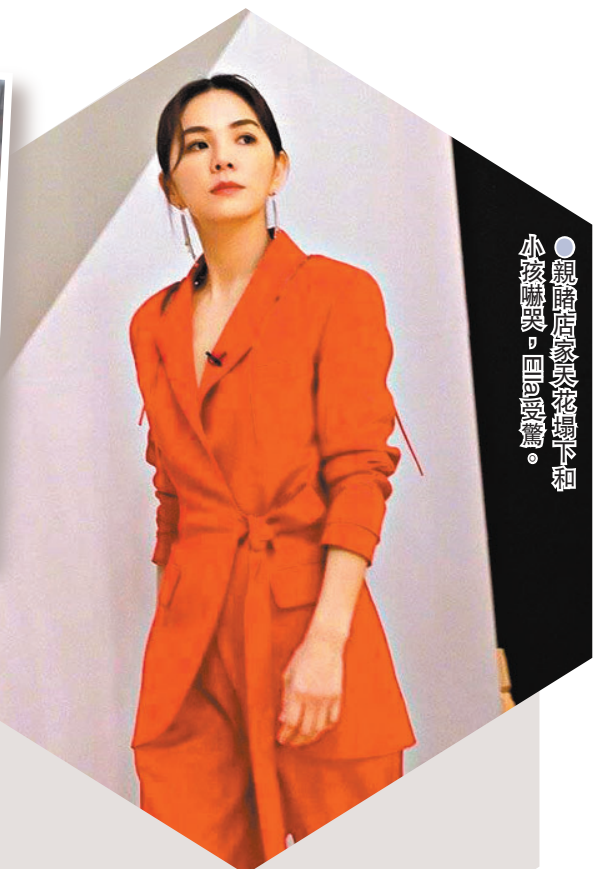
● 親臨店家災情慘重下和小孩嚇哭，四度受驚。