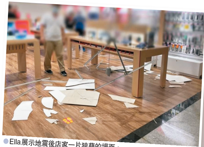
● Ella展示地震後店家一片狼藉的場面。

香港文匯報訊 台灣宜蘭24日連續發生兩次地震，分別達黎克特制6.5級和5.4級。6.5級是宜蘭地區30年來最大地震，專家稱未來3天內可能還會發生4級以上餘震。不少在台的藝人都透過社交平台發文，關心粉絲們是否無恙，其中S.H.E成員陳嘉樺地震發生時正在商場準備去看主演電影的首映，看到有店家的天花板直接掉下來，有小孩受到驚嚇在旁邊大哭，把她嚇壞。身處台灣的余文樂也感受到這次的強烈震撼，直呼：恐怖！