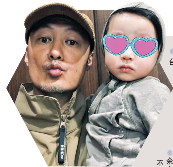
● 余文樂現身在台灣陪家人。