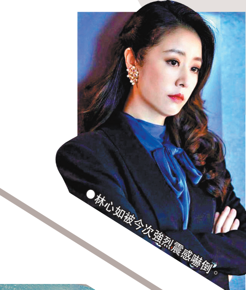
● 林心如被今次強烈震撼嚇倒。