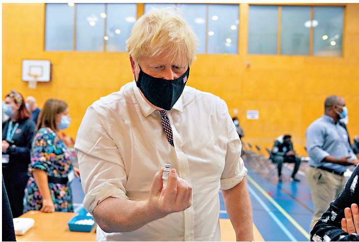
●約翰遜參觀接種中心時，手持一瓶輝瑞疫苗。