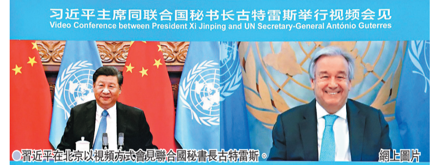
● 習近平在北京以視頻方式會見聯合國秘書長古特雷斯。

香港文匯報訊 據新華社報道，中國國家主席習近平25日上午在北京人民大會堂以視頻方式會見聯合國秘書長古特雷斯。習近平指出，今天是新中國恢復在聯合國合法席位50周年。中國舉辦紀念會議，既是為了回顧中國和聯合國共同走過的不平凡歷程，也是為了從新的歷史起點出發，攜手打造更加美好的世界。