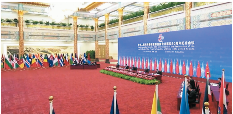
● 國家主席習近平25日在北京出席中華人民共和國恢復聯合國合法席位50周年紀念會議並發表重要講話。

2015年9月，習近平主席在紐約聯合國總部出席第70屆聯合國大會一般性辯論發表重要講話，為世界清晰擘畫打造人類命運共同體的總布局、總路徑。2017年1月，在聯合國日內瓦總部，習近平主席進一步系統闡釋人類命運共同體理念。此後，構建人類命運共同體理念載入聯大決議等多個國際文件，成為國際社會普遍共識。