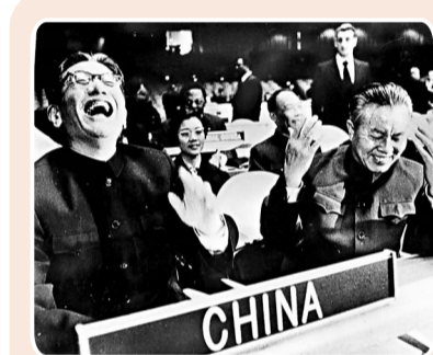
● 1971年10月25日，中國恢復在聯合國合法席位。中國代表席上時任中華人民共和國外交部副部長喬冠華(左一)仰頭大笑。