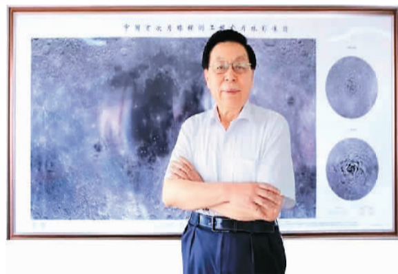
欧阳自远在嫦娥一号绘制的《中国首次月球探测工程全月球影像图》前留影。

对“嫦娥奔月”五战五捷的耀眼表现，欧阳自远自豪之情溢于言表。他称赞说，每颗探测器的表现都很出色：嫦娥一号马到成功，一举实现了绕月探测；嫦娥二号绘制出月球表面最好、最清晰的地形图与三维立体图；嫦娥三号的着陆