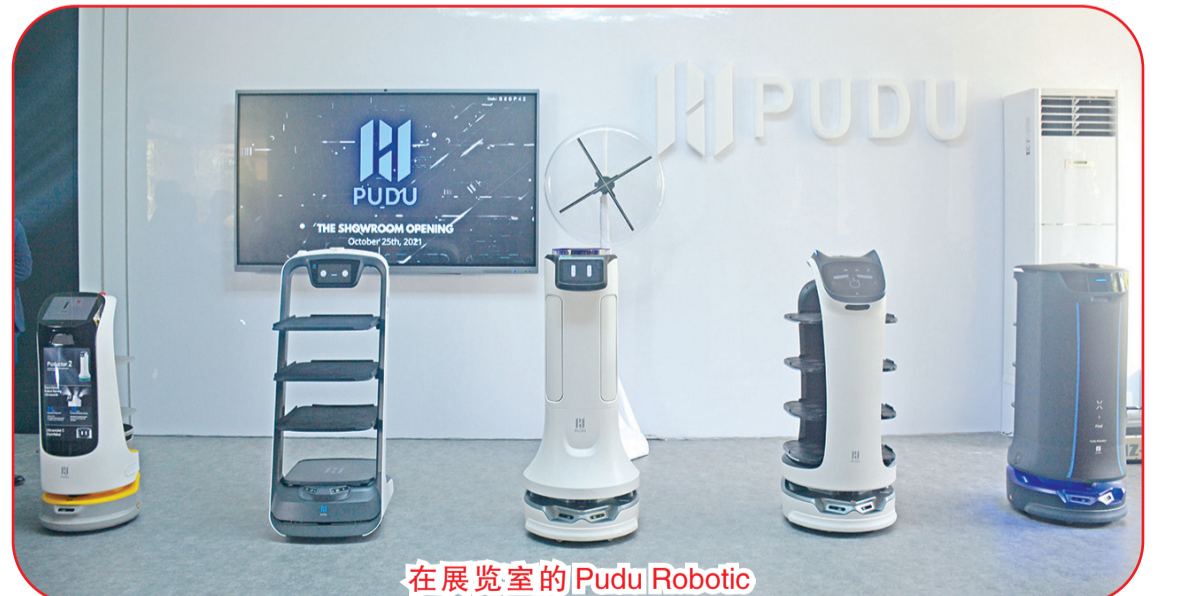
在展览室的 Pudu Robotic