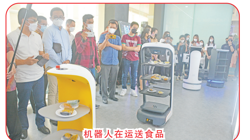
机器人在运送食品