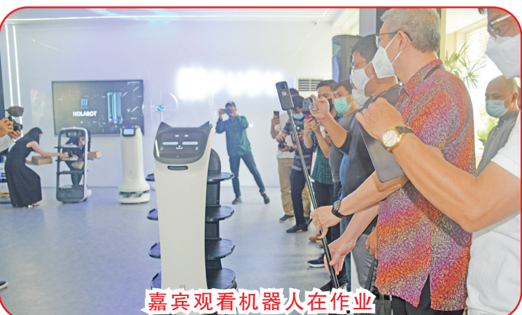
嘉宾观看机器人在作业