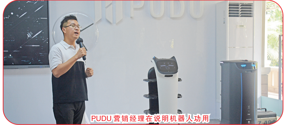
PUDU 营销经理在说明机器人功用