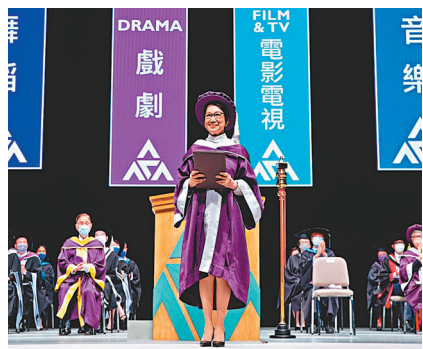
車淑梅強調藝人要有「藝德」。

香港文匯報訊 資深廣播人車淑梅日前(22日)獲香港演藝學院頒授榮譽院士，以表揚她不遺餘力推進香港的演藝行業和文化發展，以及多年來支持香港演藝學院的完善發展。