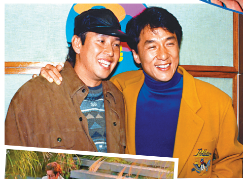
阿倫與成龍相識多年，感情深厚。