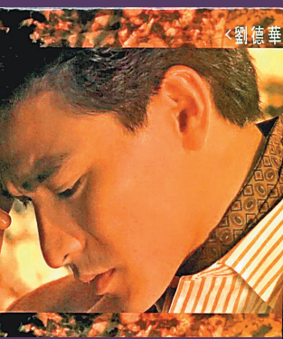
《再會了》是華仔於1990年12月發行的粵語專輯。