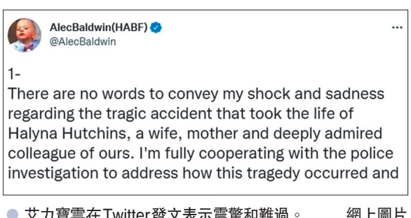
●艾力寶雲在Twitter發文表示震驚和難過。