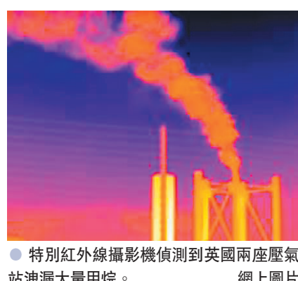
●特別紅外線攝影機偵測到英國兩座壓氣站洩漏大量甲烷。網上圖片