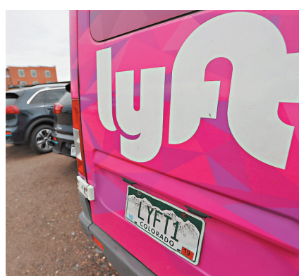
●電召車程式Lyft每年接獲的性侵個案持續上升。資料圖片