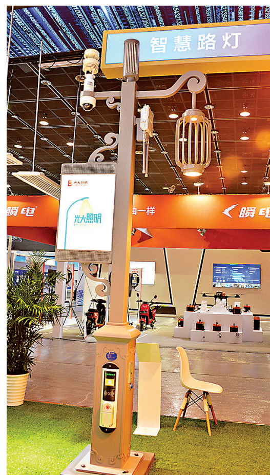
集智能照明、安防監控、環境監測等功能於一體的智慧路燈。