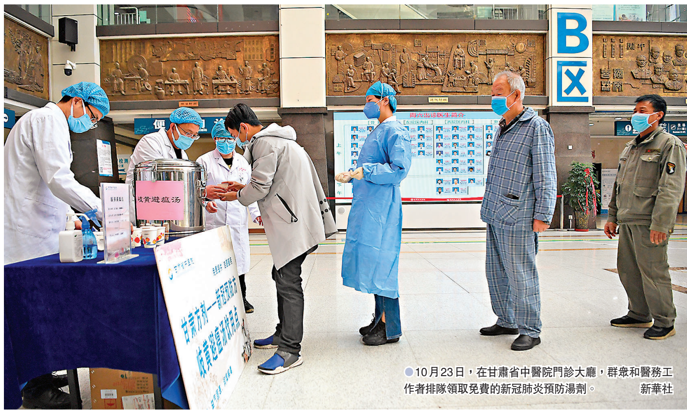
10月23日，在甘肅省中醫院門診大廳，群眾和醫務工作者排隊領取免費的新冠肺炎預防湯劑。