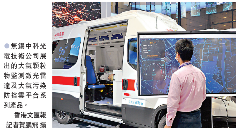
無錫中科光電技術有限公司展出的大氣顆粒物監測激光雷達及大氣污染防控雲平台系列產品。