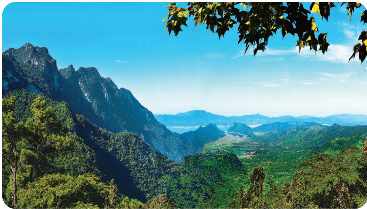
图①：三江源国家公园地处青藏高原腹地，是长江、黄河、澜沧江的发源地，是名副其实的“中华水塔”，也是中国重要的淡水供给地和生物多样性保护优先区之一。