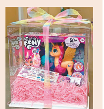
禮物包贈《文匯報》讀者

電影公司現送出《小馬寶莉：新世代》禮物包10套予《文匯報》讀者，有興趣的讀者們請剪下印花，寄往香港仔田灣海旁道7號與偉中心3樓，信封註明「娛樂組送卡通電影禮物包」，內裏請附上姓名、電話及電郵，將有專人聯絡領取，送完即止。