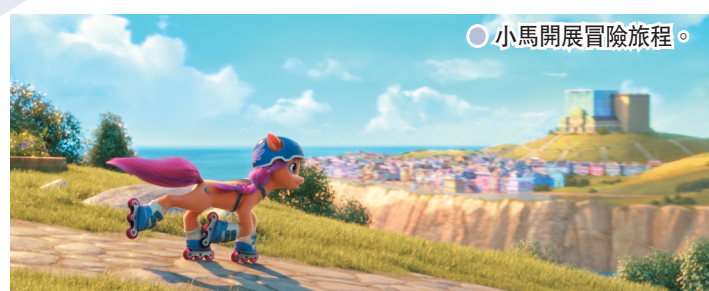
小馬開展冒險旅程。