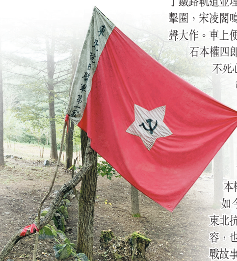
▼ 東北抗日聯軍軍旗。