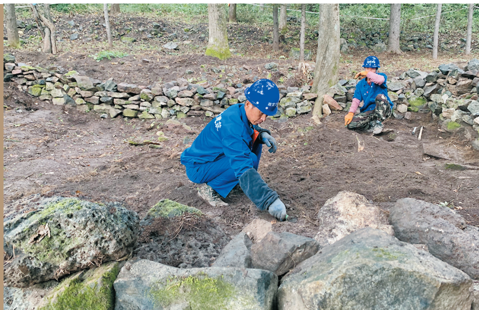
◀ 勘探工人在對遺址遺蹟進行探尋和清理。