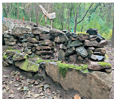
▼ 原樣保存完好的雙洞抗聯密營灶台，通過灶台的大 小和數量能夠推斷出在這裏駐紮的抗聯戰士的人數。