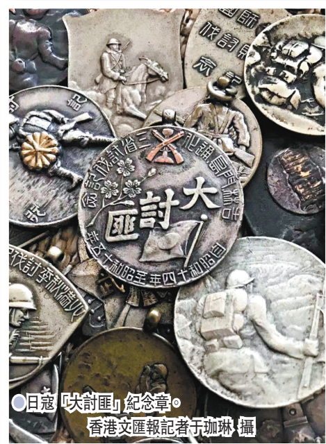
●日寇「大討匪」紀念章。