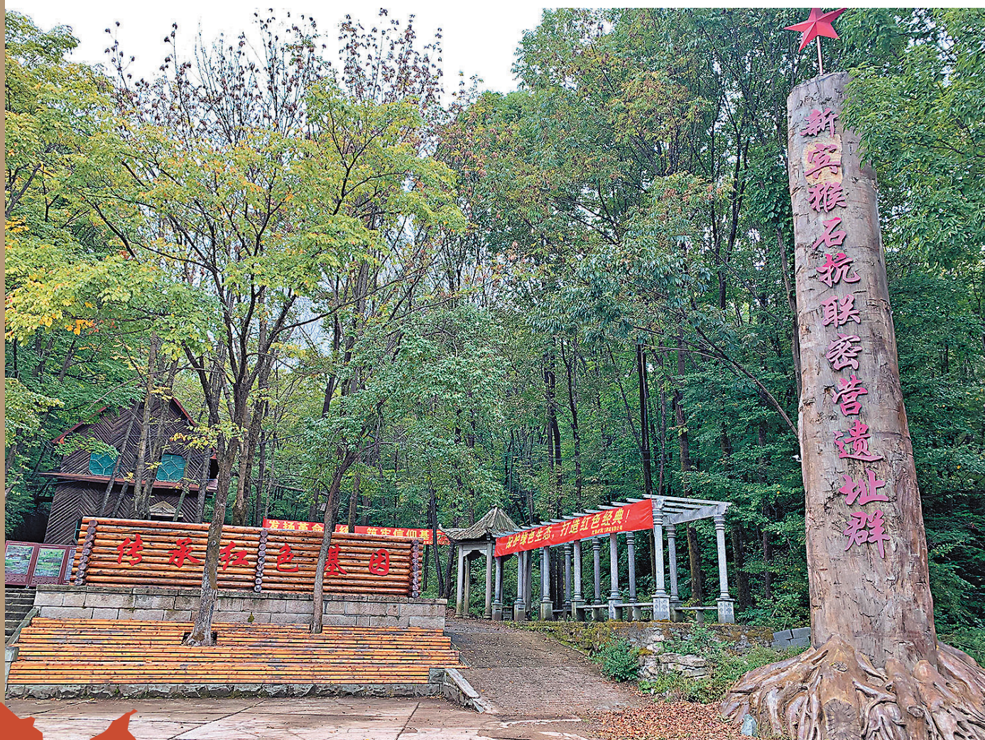
● 遼寧省撫順市的新賓猴石抗聯密營遺址遺蹟群門口。