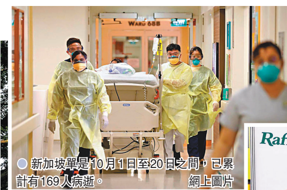
●新加坡單是10月1日至20日之間，已累計有169人病歿。

這個月的死亡個案中，大部分死者均未完成接種疫苗，反映在Delta變種病毒持續蔓延下，未打針人士面對極高風險。