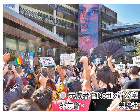
●示威者在Netflix辦公室外集會。