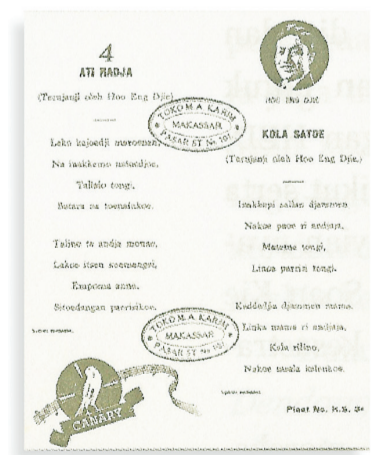
何英如的《国王的心》

获得了另一项荣誉:苏加诺总统邀请何英如到总统府一同讨论望加锡和布吉斯的音乐。1953年9月3日,何英如欣然受邀前往总统府。据媒体报道,苏加诺总统对何英如的观点非常感兴趣。会谈期间,何英如得以诉说土生华人群体的困难,尤其是经济方面的困难。