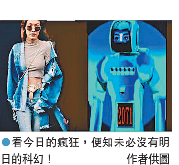
看今日的瘋狂，便知未必沒有明日的科幻！