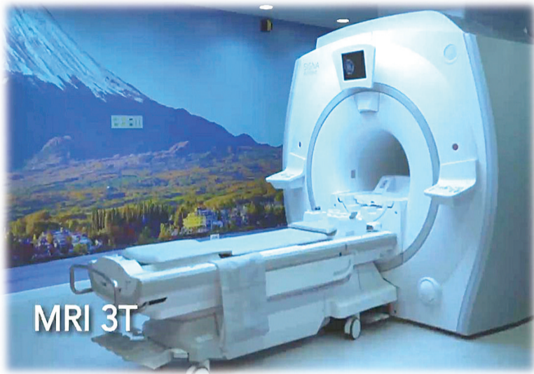
4D 3T核磁共振(MRI 3.0 Tesla)扫描机