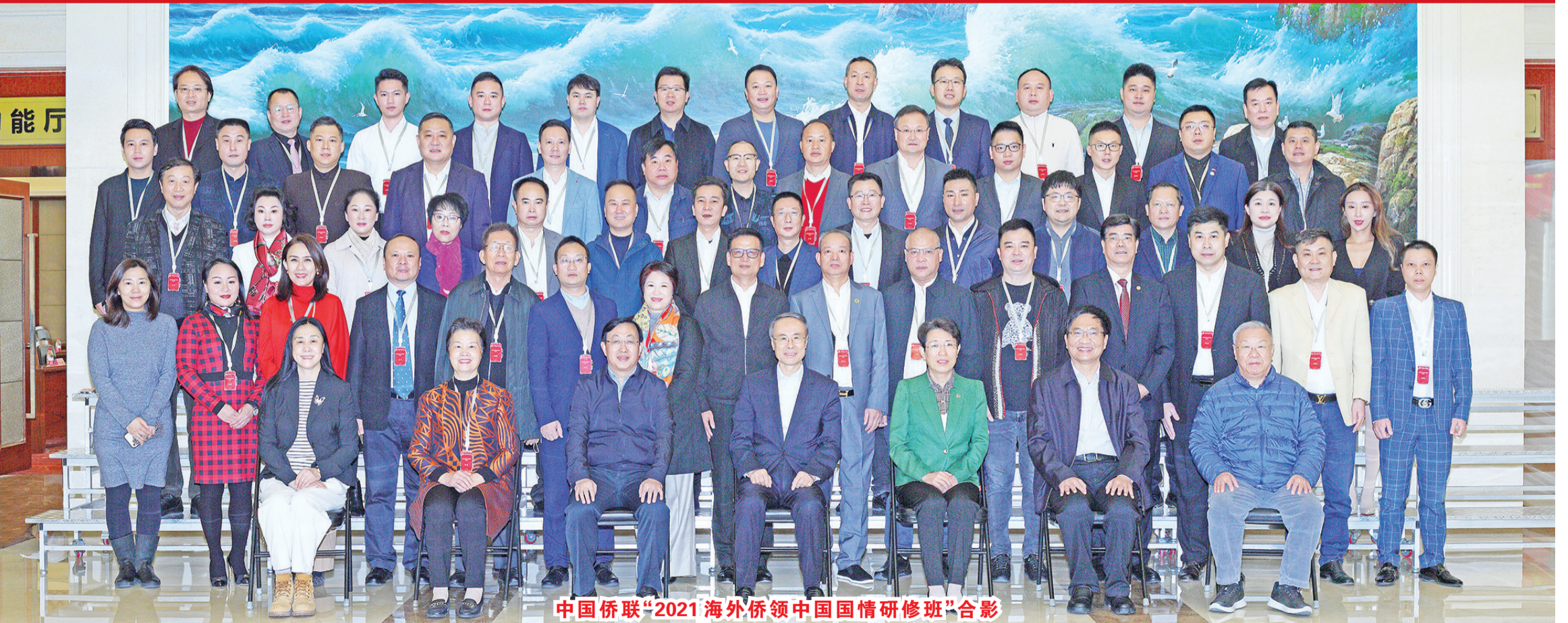
中国侨联“2021海外侨领中国国情研修班”合影