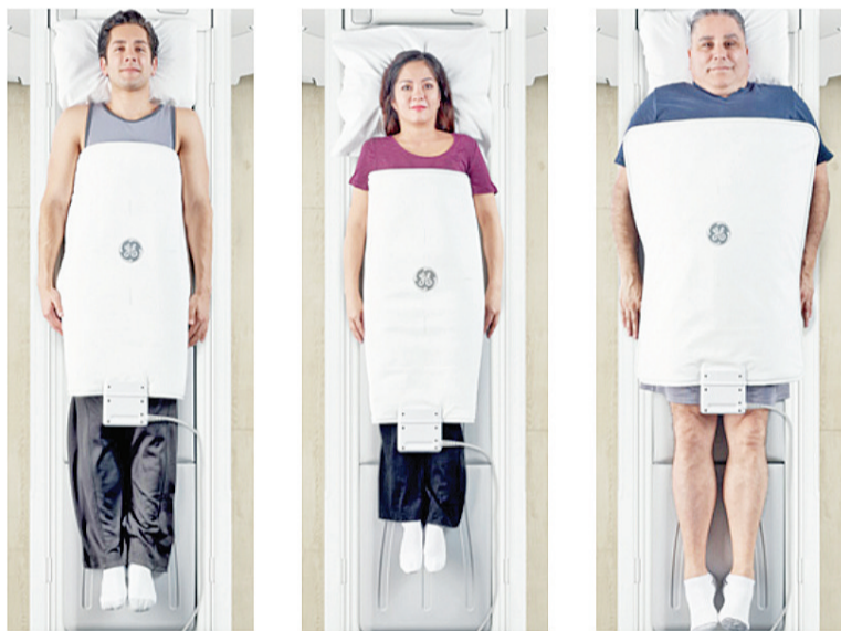
扫描的配件也不一样