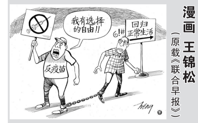
漫画 王锦松 (原载《联合早报》)