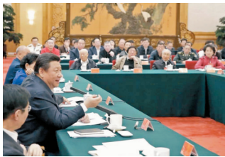
●習近平總書記2014年10月15日在文藝工作座談會上發表重要講話。