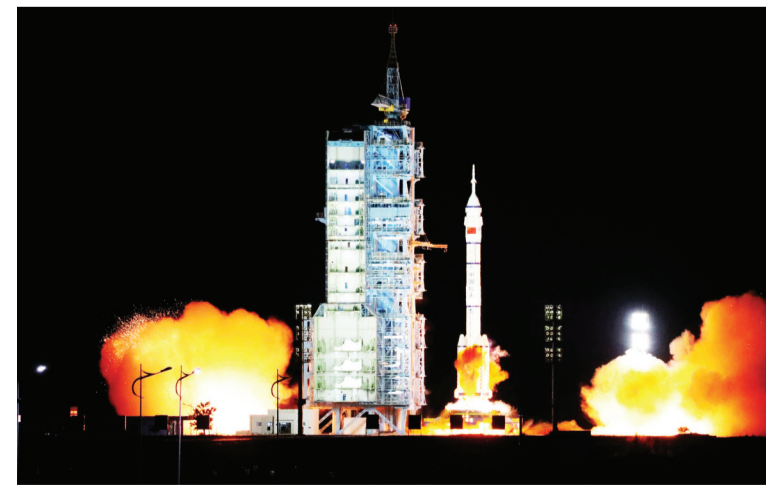
2021年10月16日0时23分,搭载神舟十三号载人飞船的长征二号F遥十三运载火箭,在酒泉卫星发射中心按照预定时间精准点火发射,约582秒后,神舟十三号载人飞船与火箭成功分离,进入预定轨道,顺利将翟志刚、王亚平、叶光富等3名航天员送入太空,飞行乘组状态良好,发射取得圆满成功。

一名海外留学青年,看到火箭升空的那一刻,感到非常震撼,虽然身在他乡,会通过继续努力学习深造,承担起国家和社会责任!”