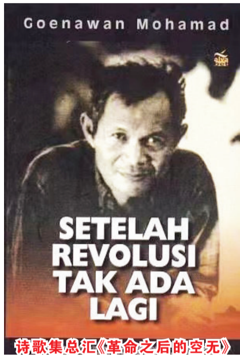
诗歌集总汇《革命之后的空无》