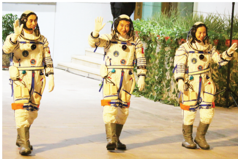
翟志刚(中)、王亚平(右)和叶光富即将开启为期6个月的飞行任务。

中新社北京10月16日电(李翔吴侃)北京时间2021年10月16日0时23分,搭载翟志刚、王亚平、叶光富3名航天员的神舟十三号载人飞船在酒泉卫星发射中心发射升空,随后进入预定轨道。