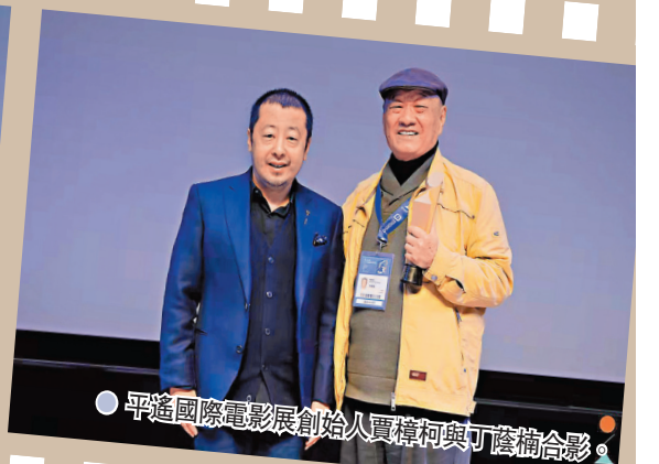
平遙國際電影展創始人賈樟柯與丁蔭楠合影。