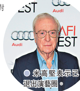
● 米高堅表示已退出演藝圈。

據外國媒體報道,現年88歲的英國資深演員米高堅日前在接受BBC電台訪問時透露,自己近年來困擾於脊椎與雙腿虛弱問題,已經有將近2年的時間沒有好好地演戲,他自認已經完成了演員的工作,目前他將會卸下演員身份,改以作家的身份繼續工作。米高堅形容「這非常有趣,身為演員,你必須早上六點半去片場報到。但如今身為作家後,你不用離開床鋪就可以馬上工作。」