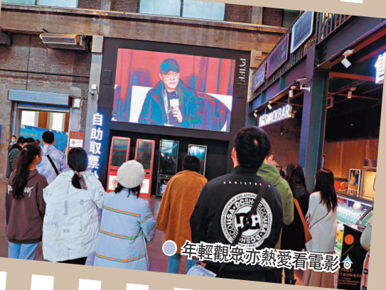
年輕觀眾亦熱愛看電影。