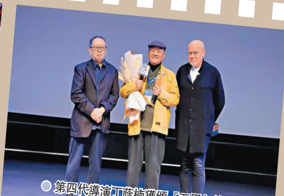
第四代導演丁蔭楠獲頒「五周年特別獎」。