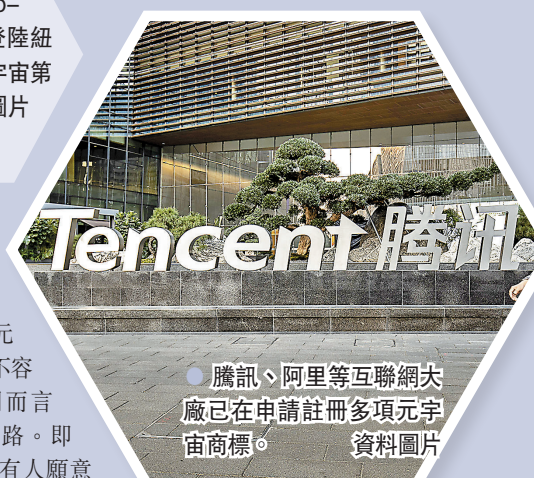
●騰訊、阿里等互聯網大廠已在申請註冊多項元宇宙商標。資料圖片

◀ 在線創作沙盒遊戲平台Roblox今年3月登陸紐交所，成為元宇宙第一股。網絡圖片