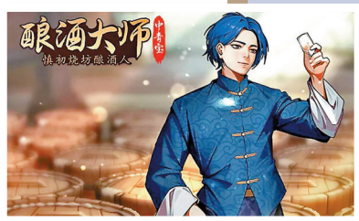
▲ A股公司趕搭元宇宙概念，包括中青寶聲稱將推出首款元宇宙遊戲《釀酒大師》。

今年元宇宙概念似乎又令VR/AR行業找到新的支撐，僅上半年內地VR/AR行業相關企業就已有20件股權投融資事件，金額為28.33億元，還未計入字節跳動收購Pico。按元宇宙當前的熱度，料四季度VR/AR行業的投融資事件、金額都會有明顯增加。