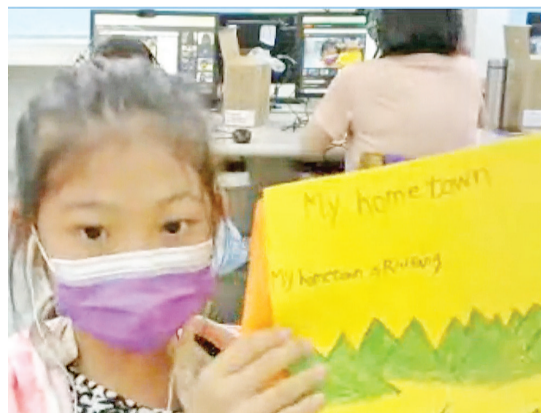
瑞芳小朋友介绍家乡