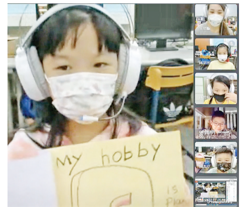
瑞芳国小作自我介绍