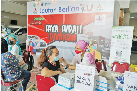
在接受科兴疫苗接种