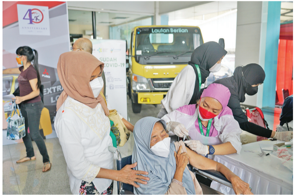
德拉延蒂的母亲在接受疫苗接种