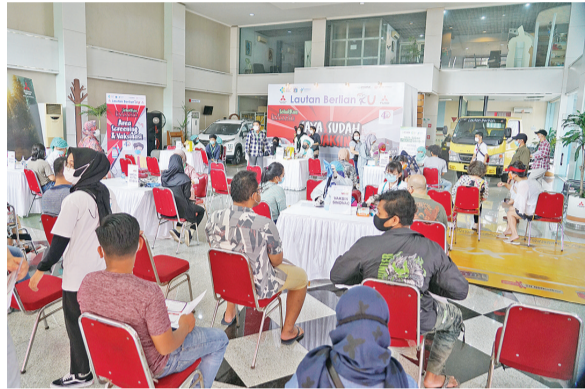
疫苗接种活动情景