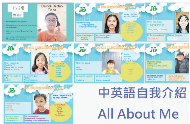
JTS G4 自我介绍

多麽令人期待的体验啊! 活动最后由雅台小尖兵穿著印尼传统蜡染服饰(Batik), 生动地展现传统文化之美, 将代表著印尼各处特色的文化遗产呈现在台湾小朋友面前, 用丰富的对比色彩及图腾传递美的讯息: 他们有的介绍不同的蜡染图案、有的述说适宜穿著蜡染服饰的场合、也有人娓娓道来Batik的制作方式, 每个小尖兵彷彿是印尼文化大使一般, 以有趣活泼自然的口吻推广著本土文化。活动最后由所有小尖兵们一起留下大合照, 为交流活动画下完美的句点, 也让每一位同学更期待下一次的会面, 殷切期待著又能体验到甚麽不同的文化呢? 本次相关活动视频请见: https://youtu.be/Os1KWhmYcLo