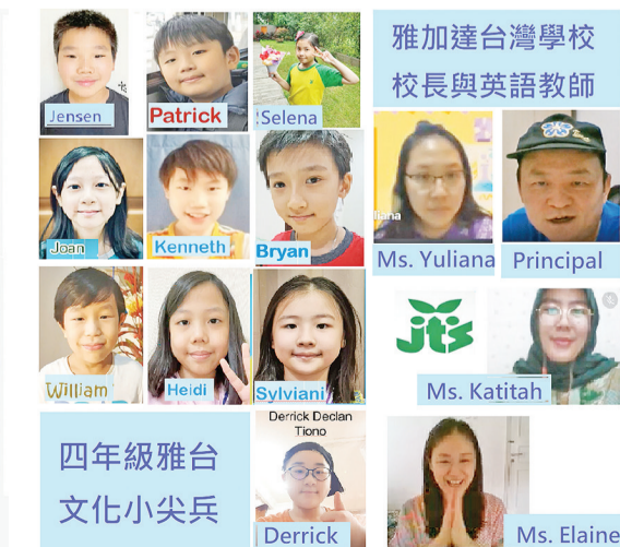
JTS G4 小尖兵及教師團隊