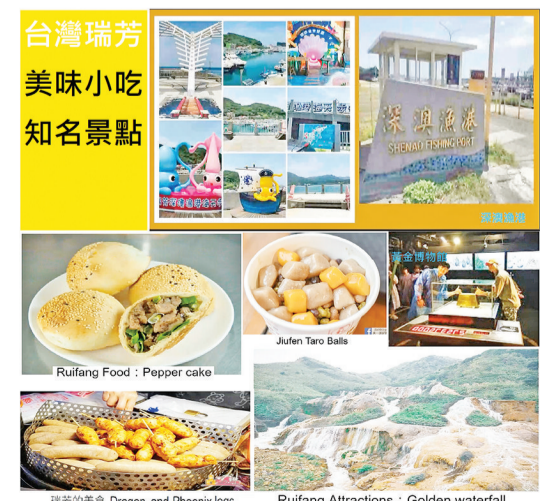
瑞芳美味小吃與知名景點