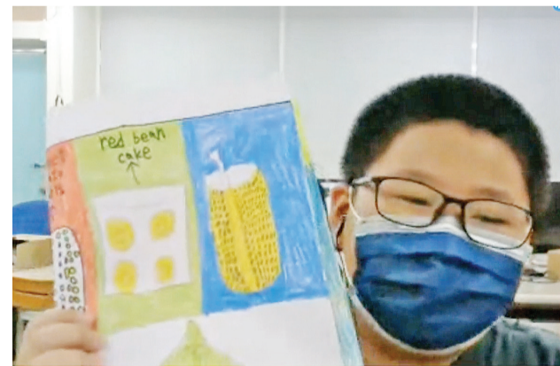
瑞芳小朋友介绍台湾美食