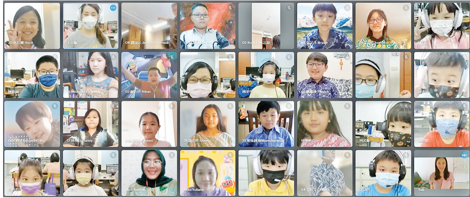
印尼 Batik 传统蜡染大合照

【本报讯】自2020年第1届雅台文化小尖兵的国际交流活动大受欢迎之后, 2021年雅加达台北学校(Jakarta Taipei School)与台湾的瑞芳国小, 延续台湾与印尼两地的交流, 展开第2届“双文化、三语言、世界呱呱走”国际交流活动, 虽然因疫情而无法实地参访, 学生们还是能透过网路遨游在世界的另一端, 体验不同文化之美, 更深入地了解家乡传统与日常, 灵活地运用中、英、印三语互相交流讨论, 在无形中推进跨文化交流, 拓展多元的国际观。 双方学校的文化小尖兵在活动中扮演著重要的角色, 将自己国家的文化转化为有趣丰富的经验与对方分享, 参与活动的同学在线上学习期间